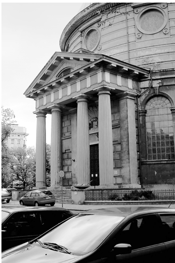
Kościół ewangelicko-augsburski św. Trójcy, pl. Małachowskiego