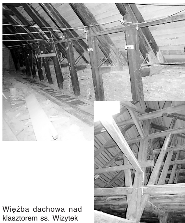
Więźba dachowa nad klasztorem ss. Wazytek