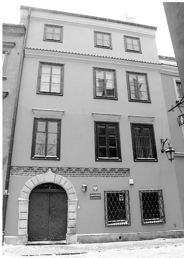
Kamienica przy ul. Krzywe Koło 7