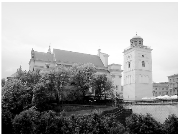
Kościół św. Anny z dzwonnica