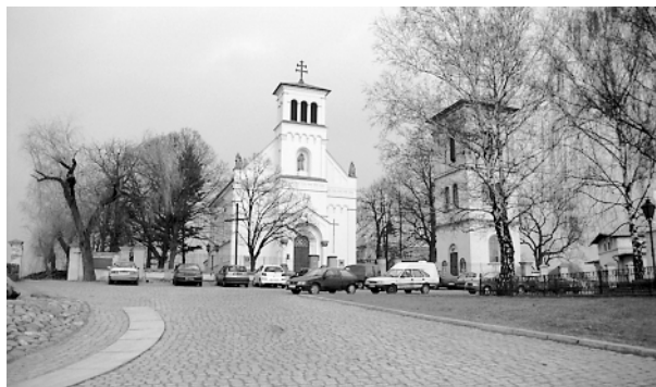
Kościół św. Katarzyny