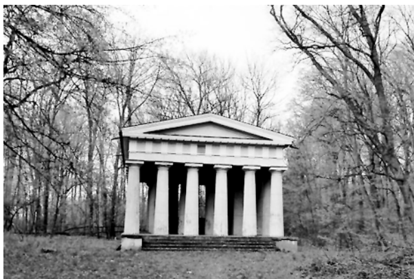
Świątynia dorycka w zespole pałacowo-parkowym w Natolinie