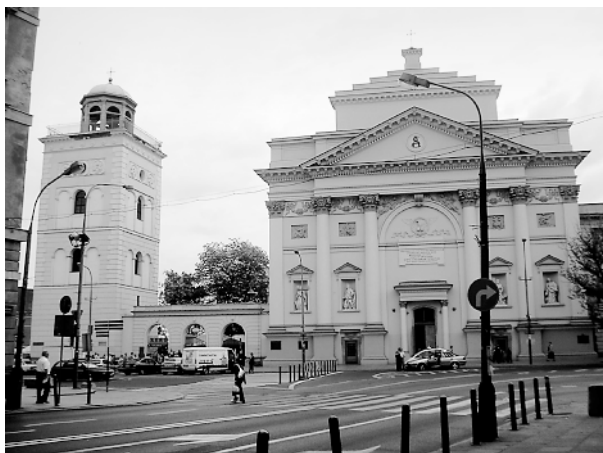
Kościół św. Anny z dzwonnica