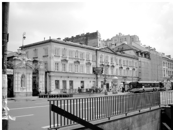
Dawny szpital św. Rocha