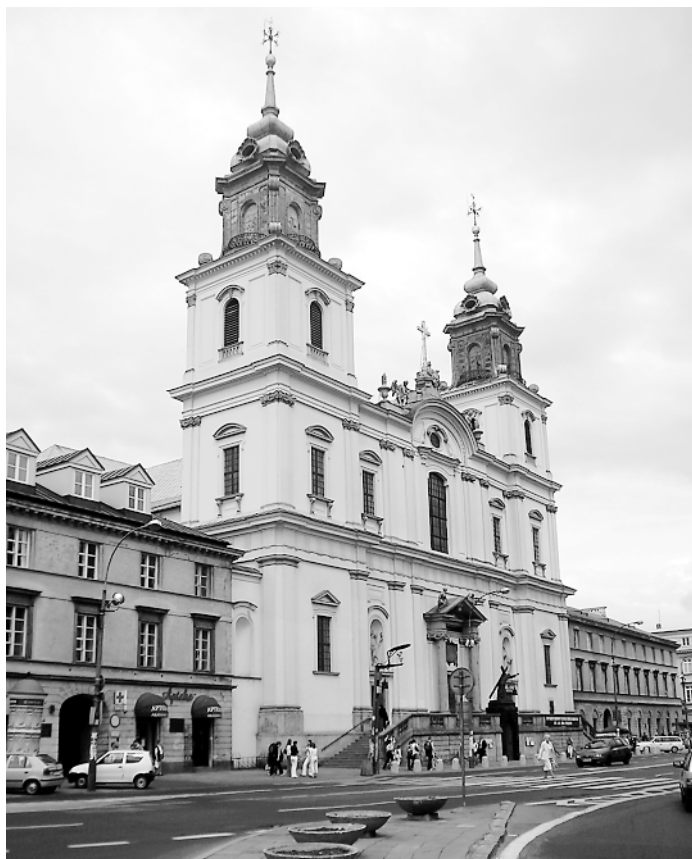
Kościół św. Krzyża

Reasumując, mimo licznych niedociągnięć czy częściowych zwrotów niewykorzystanych kwot dotacji należy uznać, że wypracowana uchwałą finansowa forma wspierania właścicieli obiektów zabytkowych na terenie miasta Warszawy zdaje egzamin w praktyce oraz wypełnia nałożone przez art. 4 pkt 1 ustawy o ochronie zabytków i opiece nad zabytkami polecenie podejmowania przez organy administracji publicznej działań mających na celu zapewnienie warunków organizacyjnych i finansowych umożliwiających trwałe zachowanie zabytków oraz ich zagospodarowanie i utrzymanie.