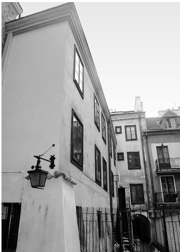
Kamienica przy ul. Krzywe Koło 7 – elewacja od dziedzińca