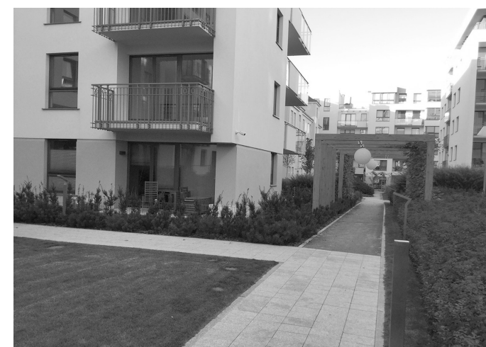
Il. 6. Gdańsk, Dzielnica Garnizon, Wnętrze kwartału zabudowy, ul. Stachury 5 – M. Hemara 2 / Gdańsk, Garnizon District, The interior of urban block at Stachury 5 Street and M. Hemara 2 Street

Why is the gradation of space such an essential factor affecting man’s wellbeing? It is because unwanted social contacts cause us to feel “overwhelmed”, the lack of an “intermediate” zone leads to man not being able to decide who and how often he would