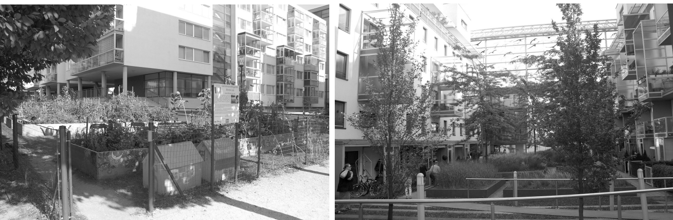
Il. 3. Wiedeń, Monte Laa, Zielony dziedziniec – przestrzeń sąsiedzka / Vienna, Monte Laa, Green courtyard – neighbourly space

Ślady partycypacji mieszkańców w organizacji życia osiedla, są mocno zauważalne. Ten najbardziej widoczny to urządzenie ogródka warzywnego i kwiatowego (il. 2), na uboczu Parku Monte Laa.