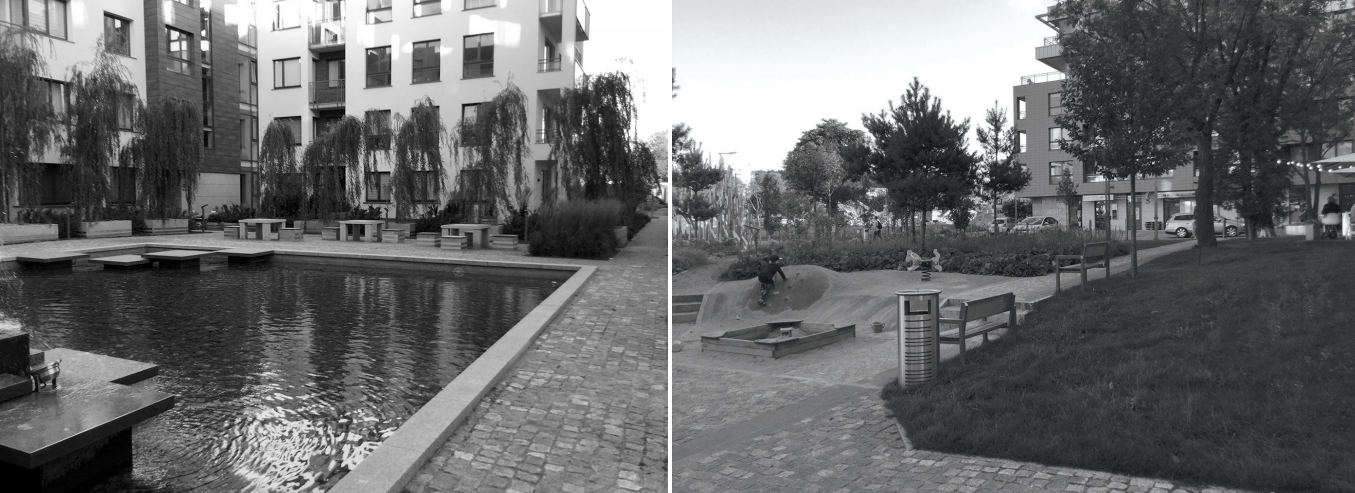
Il. 4. Gdańsk, Dzielnica Garnizon, Przeszłość sąsiedzka w kwartale zabudowy, ul. Stachury 1-3, Szymanowskiego / Gdańsk, Garnizon District, Neighbourly space in the urban block at 1-3 Stachury Street, Szymanowskiego Street