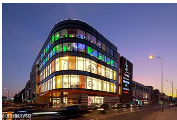
Fig. 3a. Modernist, concrete architecture of the German gastronomic complex Haus Ponath (1929). Source: [16]. 3b. After the war, transformed to the „Kaskada” restaurant, and after fire to the shopping mall „Galeria Kaskada”, al. Wyzwolenia in Szczecin by to the design of arch. Zbigniew Paszkowski - and Autorska Pracownia Architektury URBICON. Source: [17]

Ryc. 3a. Modernistyczna, betonowa architektura niemieckiego kompleksu gastronomicznego Haus Ponath (1929). Źródło: [16] 3b. Po wojnie zaadaptowana na restaurację „Kaskada”, a po spaleniu na „Galerię Kaskada”, al. Wyzwolenia w Szczecinie wg projektu arch. Zbigniewa Paszkowskiego i spółki Autorska Pracownia Architektury URBICON. Źródło: [17]