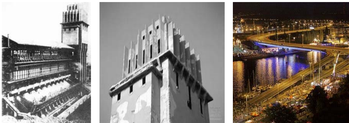
Fig. 5a, b, c. Modernist industrial architecture - a concrete coal Tower of coking plants at Koksowa street. Pre-war condition. Source: [20]; b. Today's condition. Source: [21]; c. View of Trasa Zamkowa in Szczecin. a; Source: [22].

Ryc. 5a, b, c. Modernistyczna architektura przemysłowa - betonowa Wieża węglowa zakładów koksowych przy ul. Koksowej. a. Stan przedwojenny. Źródło: [20]; b. Stan obecny. Źródło: [21]; c. Widok Trasy Zamkowej w Szczecinie. Źródło: [22]