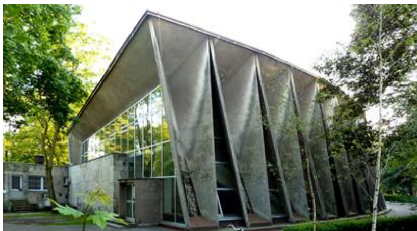
Fig. 6. The "Copernicus Hall" of the Pomeranian Medical University at the hospital in Pomorzany. Author arch. Marian Rąbek, l. 60. XX century. Source: [23]

Ryc. 5a, b, c. Modernistyczna architektura przemysłowa - betonowa Wieża węglowa zakładów koksowych przy ul. Koksowej. a. Stan przedwojenny. Źródło: [20]; b. Stan obecny. Źródło: [21]; c. Widok Trasy Zamkowej w Szczecinie. Źródło: [22]