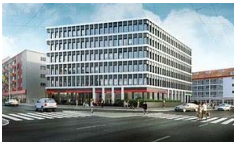
Fig. 9a. Pavilions „Grzybek” and „Okraglak” at the demolition stage in 2006. Source: [26]. 9b. New office development in the reinforced concrete skeleton emphasized on the façade “Brama Portowa I” from 2011-12. Source: [27]

Ryc. 9a. Pawilony „Grzybek” and „Okraglak” na trakcie rozbiórki w 2006 roku. Źródło: [26]. 9b. Nowa zabudowa biurowa w podkreślonej na elewacji konstrukcji szkieletu żelbetowego “Brama Portowa I” z 2011-12. Źródło: [27]