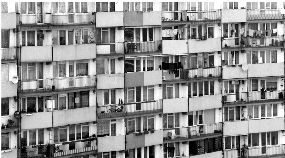
Fig. 8. Typical housing development erected in the 1980s in the technology of a large slab. Ryc. 8. Typowa zabudowa mieszkaniowa wznoszona w I. 80. XX wieku w technologii wielkiej płyty.

A side effect of the mass production of apartments, outgoing in the period of the Polish People's Republic in state-owned industrial construction enterprises, at so-called home factories was functional and formal uniformity. Concrete architecture of necessity are often objects with low architectural qualities, which are generally still accepted, despite the fact that they represent low compositional and building quality, but still respond to basic housing needs. The reason for this is the cost and inability to replace them with other buildings, the implementation of which exceeds the financial possibilities of society [1].