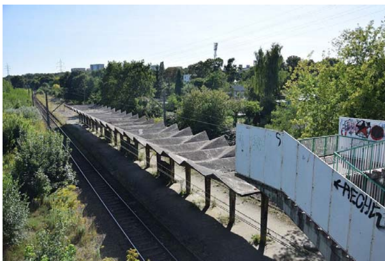
Fig. 7a. View of the viaduct and exit from Mickiewicza street from the former railway stop in Pogodno in Szczecin - condition of today.

In the year 2017, three young architects from Szczecin: Igor Klyus, Sebastian Łabędź, Krzysztof Żywucki tried to save the modernist from demolition and pointed out the exceptional architectural value of the train stop during presentation for the Association of the Szczecin Metropolitan Area (which is responsible for the construction of the Szczecin Metropolitan Railways). They also prepared concept of renovation of the station and visualizations showing what a stopover after modernization might look like (Fig. 7 a,b). The Municipal Heritage Conservator of Szczecin issued a positive opinion about this initiative and thus characterizes it: An excellent modernist object certainly worth preserving as a valuable part of contemporary culture. Currently, the shelter is not in the best technical condition, but it should certainly be maintained, revitalized as part of a new station. Destroyed elements have to be recreated (Gwiazdowska, 2018, s. 1).