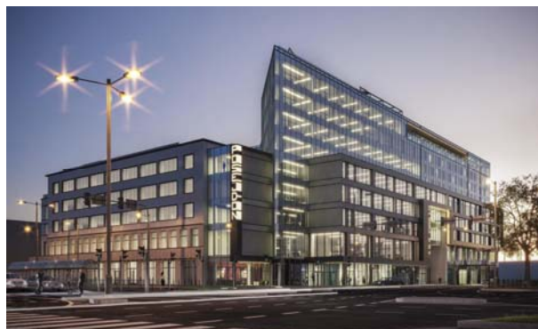
Fig. 2a. Modernista, concrete architecture of the German department store and cinema UFA Palast (1929), Stettin Paradeplatz. Source: [14]. 2b. He was transformed after the war into the department store Posejdon and in the 90s XX century a „Galeria Centrum”; currently, the quarter is being expanded also in the reinforced concrete structure into the „Posejdon” business center, Wyzwolenia street in Szczecin; project of the company FBA - arch. Ryszard Burbicki. Source: [15]

Ryc. 2a. Modernistyczna, betonowa architektura niemieckiego domu handlowego i kina UFA Palast przy Paradeplatz (1929). Źródło: [14]. 2b. Został i przekształcony po wojnie na dom handlowy Posejdon i w latach 90. na „Galerię Centrum”; obecnie trwa rozbudowa kwartału także w konstrukcji żelbetowej w centrum biznesowe „Posejdon”, al. Wyzwolenia w Szczecinie, projekt spółki FBA – arch. Ryszarda Burbickiego. Źródło: [15]