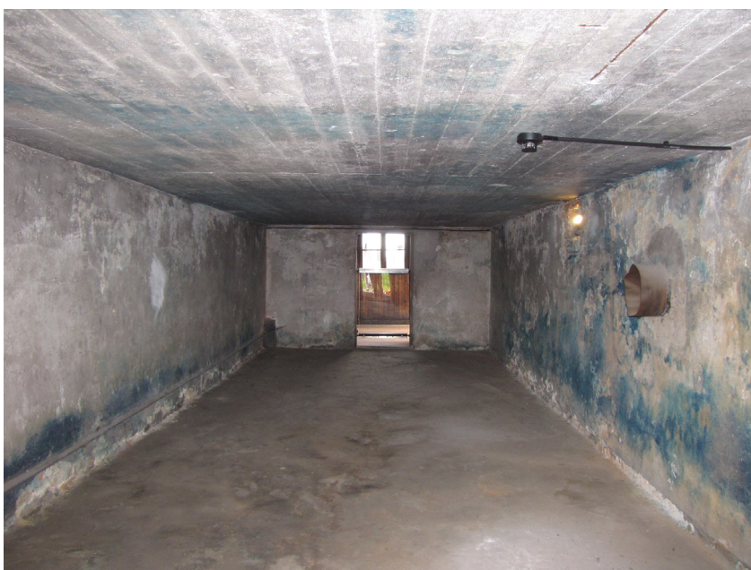
Fot.2. Zabytek i miejsce pamięci. Komora gazowa ze przebarwieniami tynku na skutek działania gazu cyklon B – dawny niemieckiego obozu koncentracyjnego Majdanek