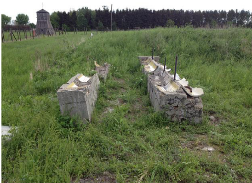
Fot.1. Zabytek i miejsce pamięci. Zniszczone postumenty umywalni – jedyna materialna pozostałość po barakach na polu dawnego niemieckiego obozu koncentracyjnego Majdanek