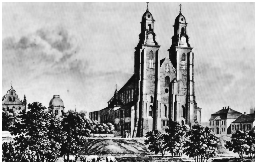
Ryc. 1. Wzgórze Lecha z katedrą, kościołem św. Jerzego i dzwonnica. Staloryt J. G. A. Frenzla z 1829 roku. Źródło: Pasiciel, 1989, str. 44 2

Głównym celem badań była analiza stanu historycznego i aktualnego wybranych terenów zieleni miasta Gniezno z podkreśleniem zachowania panoram na dominantę Pomnika Historii Katedrę Gnieźnieńską. Miejsce to dla wielu pokoleń Polaków jest kolebką chrześcijaństwa polskiego i polskości.