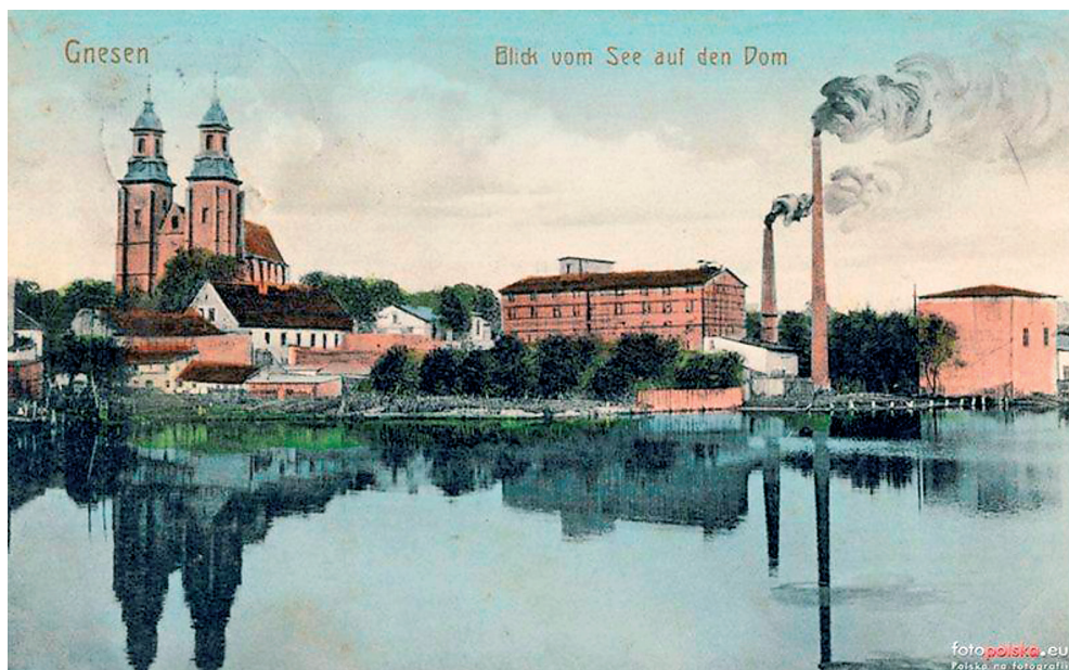
Ryc. 3. Poczтівka z początku XX wieku, z widokiem na Katedrę Gnieźnienską z zachodniego brzegu jeziora Jelonek.

Na początku XX wieku narastający chaos przestrzenny jak i industrialny charakter nadbrzeża Jeziora Jelonek w postaci między innymi dwóch kominów zdecydowanie zdewastował krajobraz miasta.