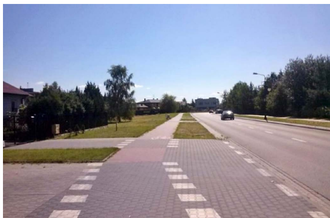
Fig. 3. The only shared-use route for pedestrians and cyclists in Józefosław lacks trees and places to sit