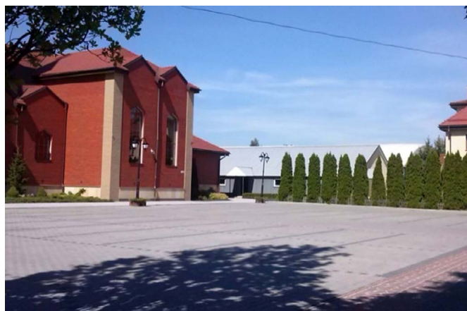
Fig. 4. Unused car park by the church