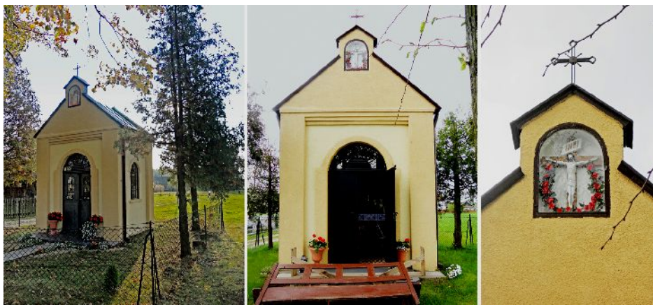
Fig.8. Brick chapel in Wydrze, located by the main road to Brzoza Stadnicka. From the left: chapel shrine surrounded by plants, front view, the gable with a niche and crucifix inside. Photo by A. Dołga, 2016.

Object № 2 – is a chapel shrine with brick construction (fig. 8) which is located on the outskirts of the village. It was built in 1959, founded by the brother of the owner – Augustyn Stopyra, who lived in USA. Until 1972 this chapel was used by local community as a church.