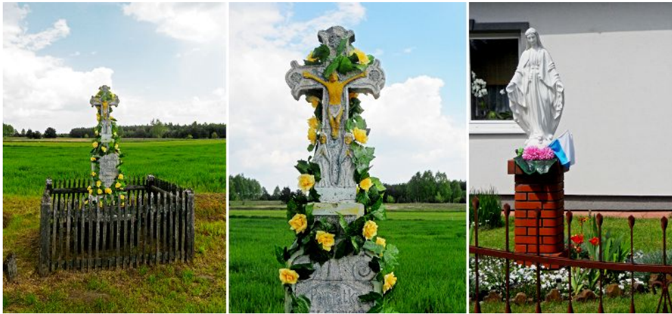
Fig. 9. Examples of small sacral architecture in Wydrze. From the left: column shrine located on the crossroads, detail of the cross, an example of contemporary pedestal shrine. Ryc. 9. Przykłady małej architektury sakralnej w Wydrzu. Od lewej: Krzyż znajdujący się na rozstaju dróg, wizerunek Pana Jezusa, przykład współczesnej kapliczki postumentowej.