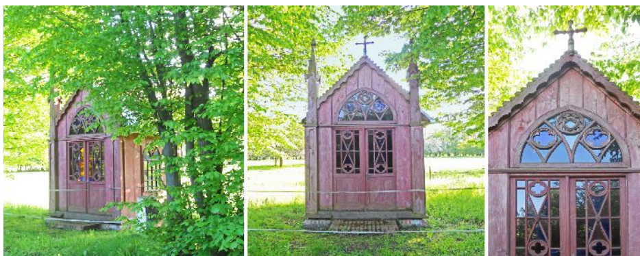
Fig.7. Wooden, neo-Gothic chapel shrine in Wydrze. From the left: chapel shrine surrounded by plants, front view, detail of the entrance.

Ryc. 7. Drewniana kapliczka domkowa znajdująca się na terenie wsi Wydrze, wybudowana w stylu neogotyckim. Od lewej: Kapliczka domkowa w otoczeniu roślinnym, widok z przodu, detal – wejście do kapliczki.