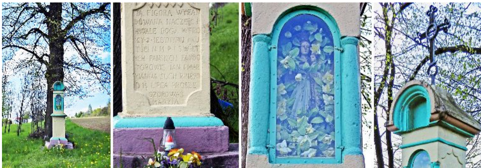
Fig.3. The column shrine by the side of the road Czarnorzeki-Podzamcze. From the left: front view, inscription, the figure of Mother of God with Child, detail of the roof.

Object № 1 – is a stone column shrine, located by the side of the road Czarnorzeki-Podzamcze, at boundaries of the village (fig.3). In the middle part, between two columns, there is a niche with the Mother of God with Child figure, covered with glass. The shrine has stone, gable roof with a steel, forged cross. The inscription in the bottom part informs about the date of foundation (15 July, 1890) and the founders (John and Marianna Such). The shrine is placed by a linden? tree and surrounded by cultivated fields.