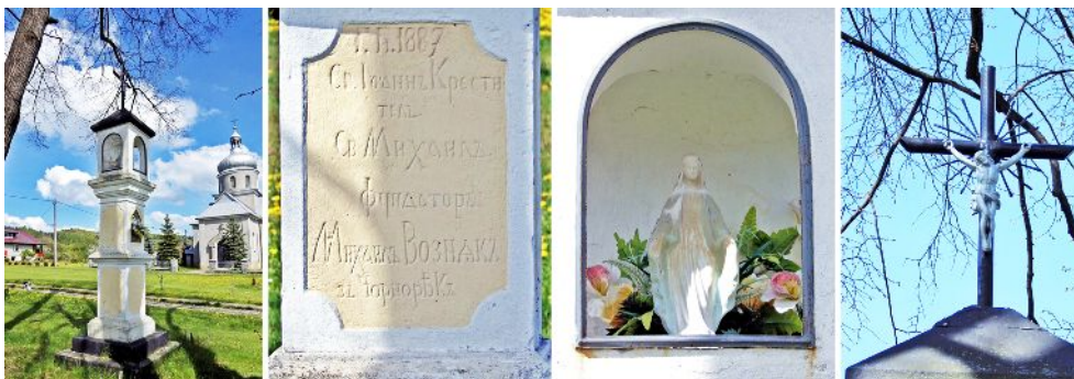
Fig.4. St. John the Baptist shrine in Czarnorzeki. From the left: front view, inscription, the figure of St. Mary, the top with steel cross.