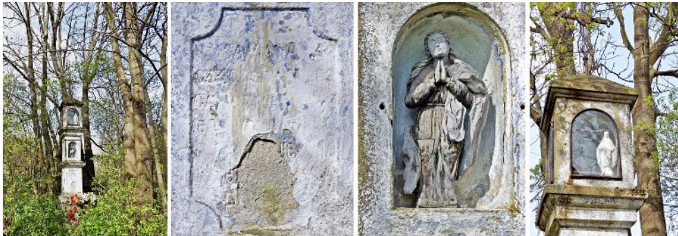
Fig.6. The stone, column shrine in Czarnorzeki. From the left: Shrine surrounded by plants, illegible inscription, detail of angel figure, the top of the shrine. 2016.

Ryc. 6. Kamienna kapliczka słupowa w Czarnorzekach. Od lewej: Kapliczka w otoczeniu ro linnym, nieczytelna inskrypcja, detal figury anioła, górna cz kapliczki. 2016.