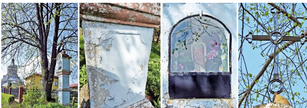
Fig.5. The column shrine in Czarnorzeki. From the left: general view, illegible inscription, the Jesus figure, detail of the cross. Photo by N. Szarek, 2016.

Object № 3 – is also a stone column shrine, divided into three main parts, situated between two lime trees. It is located near former Orthodox Church (fig. 5). It was built with stone, the upper part has a niche with the modern Jesus figure, covered with glass. The gable, stone roof is surmounted by steel, forged cross. The shrine is dated to 1880.