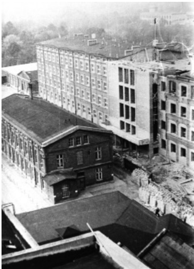
Budynek Wydziału Chemicznego 1949 r. Budowa części środkowej „łącznika”; w centrum budynek stołówki studenckiej [2]

Dalszy postęp odbywał się stopniowo. Konsekwentnie wzmocniono kadrę wykładowców. Wprowadzono studia dwustopniowe – inżynierskie i magisterskie. Zwiększono liczbę wykładowców i wyposażenie w aparaturę. Zakończono remont Gmachu Chemii. W latach 1945-1970 w sposób istotny zwiększono zarówno potencjał naukowy, jak i dydaktyczny Wydziału Chemicznego.