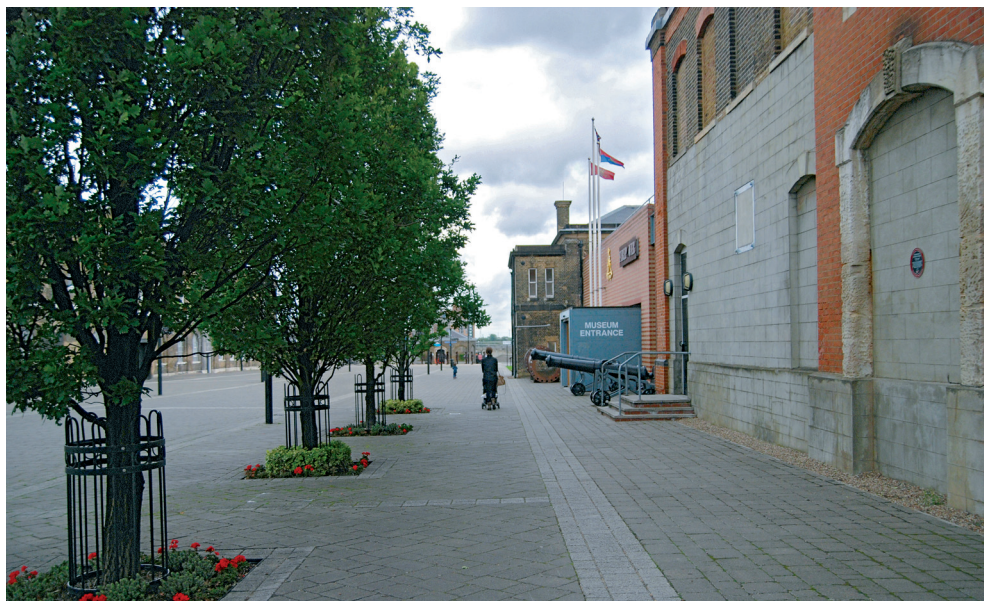
Fot. 3. Arsenał królewski w Londynie. Wejście do Muzeum Artylerii. Widoczne na zdjęciu liczne występujące na terenie arsenału obiekty strzelnicze.