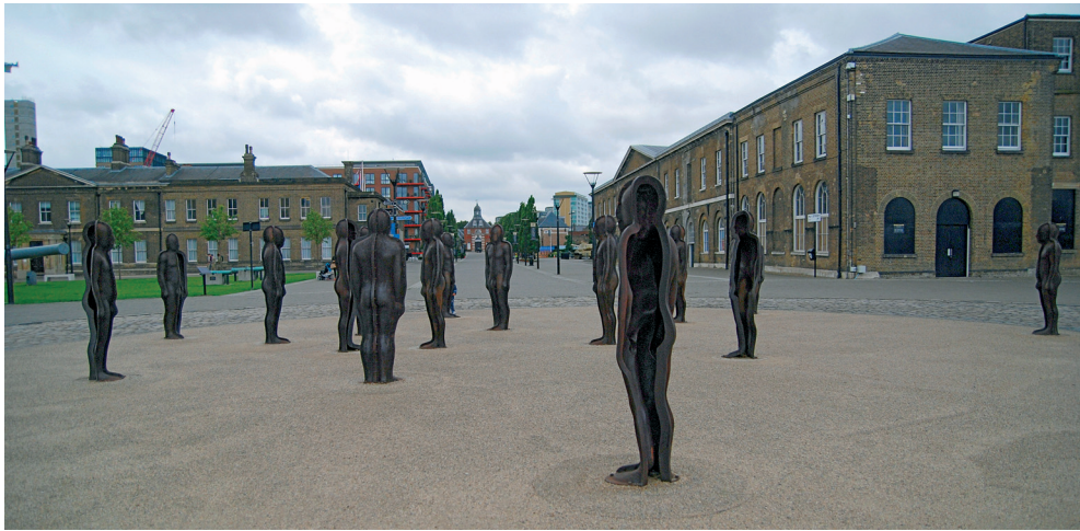
Fot. 1. Arsenał królewski w Londynie. Rzeźba na głównej osi urbanistycznej, autorstwa Petera Burke'a pt. Zgromadzenie. W tle widoczny budynek odlewni mosiądzu – najcenniejszy zabytek w zespole (Fot. Renata Józwick, 2015 r.)

nie jest czytelne poprzez wprowadzone zmiany w strukturze urbanistycznej. Fot. 3. Jest to zgodne z obecnymi tendencjami i liberalizacją postępowania wobec obiektów historycznych, czego dowodem są zapisy Rekomendacji UNESCO promujące kompromisowe rozwiązania. Znamienne jest także brak przez blisko 30 lat ustaleń konserwatorskich dla omawianego obszaru. Studium przypadku arsenału królewskiego w Londynie pokazuje wagę kontekstu dla ochrony historycznego zespołu oraz to, że czasami poprawne, lecz ogólne zapisy prawne nie gwarantują pełnej ochrony.