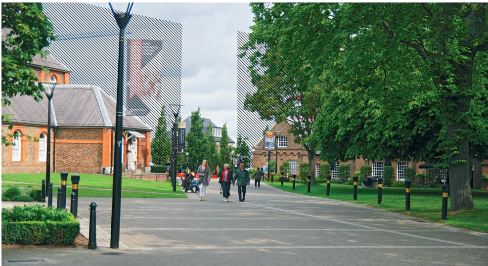
Fot. 2. Arsenał królewski w Londynie. Strefa wejściowa. Na osi widoczny wschodni pawilon laboratorium. Na zdjęciu zaznaczono planowaną 7-kondygnacyjną zabudowę, która zdominuje kluczowy widok.