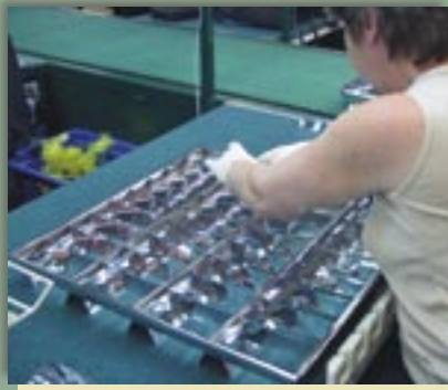
Fot. 3. Raster z widocznymi odbłaskami w czasie montażu Fot. 3. A louvre with visible reflections during assembling

z cienkiej aluminiowej blachy przeznaczone do opraw 4 x 18 W (fot. 3.).