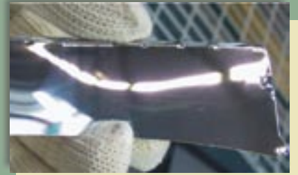
Fot. 5. Widok elementu rastra - lamelki z widocznymi odbłaskami Fot. 5. A view of a louvre - with visible reflections

szych odbłasków na nich występujących oraz w ich bliskim otoczeniu na tym samym elemencie. Na fot. 5. pokazano także element rastra – lamelkę z widocznymi odbłaskami.