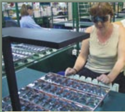
Fot. 6. Stanowisko montażu rastrów oświetlone modelem oprawy z asymetryczną płytą światłowodzącą