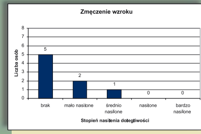
Rys. 2. Wykres zmęczenia wzroku

Znaczną poprawę wygody widzenia przedmiotów kierunkowo odbijających światło zapewnia wykonany model oprawy