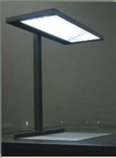
Fot. 1. Model oprawy oświetlenia miejscowego z asymetryczną płytą światłowodzącą Fot. 1. A model of local lighting luminaires with a light guiding plate and asymmetric prismatic elements

Pierwszy element znajduje się w większej odległości od światłówki, co umożliwiło przesłonięcie światłówki, wyeliminowanie światła niespolaryzowanego i zwiększenie kąta ochrony oprawy. Ostatni element ma wysokość równą grubości płyty światłowodzącej i został wyfrezowany na końcu płyty światłowodzącej. Wykonany model oprawy oświetlenia miejscowego z płytą światłowodzącą z asymetrycznymi elementami pryzmatycznymi przedstawiono na fot. 1.