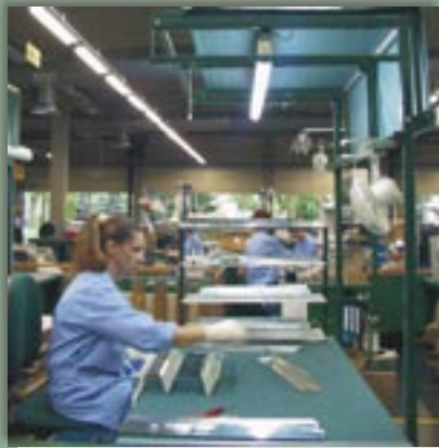
Fot. 2. Widok stanowiska ręcznego montażu rastrów Fot. 2. A view of a workstation for manual assembling of louvers

Badania fotometryczne wykonano na stanowiskach ręcznego montażu rastrów znajdujących się w hali produkcyjnej jednej z fabryk opraw oświetleniowych [3]. Stanowiska te miały jednakowe wymiary płaszczyzny roboczej (długość 1,35 m, szerokość 0,8 m) oraz jednakowe oświetlenie miejscowe, które było wykonane za pomocą oprawy jednoświatłówkowej (o mocy 36 W) typu OKJ 136 z kloszem rozpraszającym. Przykładowe stanowisko ręcznego montażu rastrów pokazano na fot. 2. Podczas wykonywania pomiarów na badanych stanowiskach montowane były wysoko polerowane (lustrzane) rastry paraboliczne, wykonane