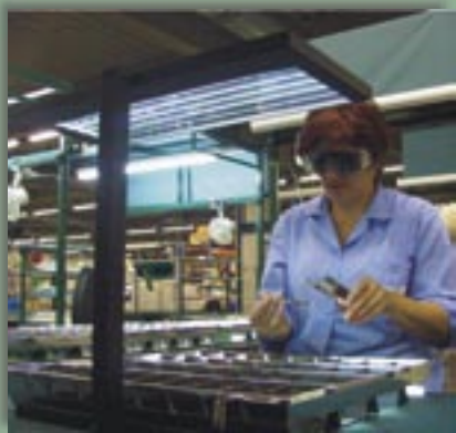
Fot. 7. Montaż rastrów na stanowisku oświetlonym modelem oprawy z asymetryczną płytą światłowodzącą