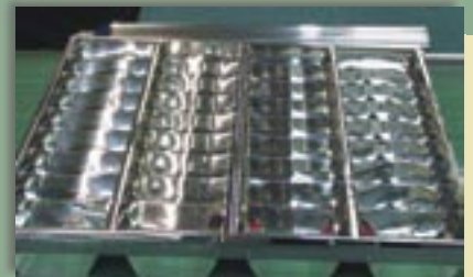
Fot. 4. Widok zmontowanego rastra z widocznymi odbłaskami Fot. 4. A view of a louvre with visible reflections

Na stanowiskach tych stwierdzono występowanie oślnienia odbiciowego na montowanych elementach rastra (fot. 3. i 4.). Jaskrawe odbłaski na lustrzanych powierzchniach rastra pochodziły przede wszystkim od oprawy oświetlenia miejscowego oraz w mniejszym stopniu od opraw oświetlenia ogólnego. W celu oceny oślnienia odbiciowego wykonano pomiary luminancji jaskrawych odbić (odbłasków) oraz wyznaczono kontrasty luminancji pomiędzy odbłaskiem a tłem, na którym odbłask się znajdował w obszarze elementów rastra. Pomiary luminancji jaskrawych odbłasków wykonano na poszczególnych elementach składowych rastra, w obszarach najwięk-