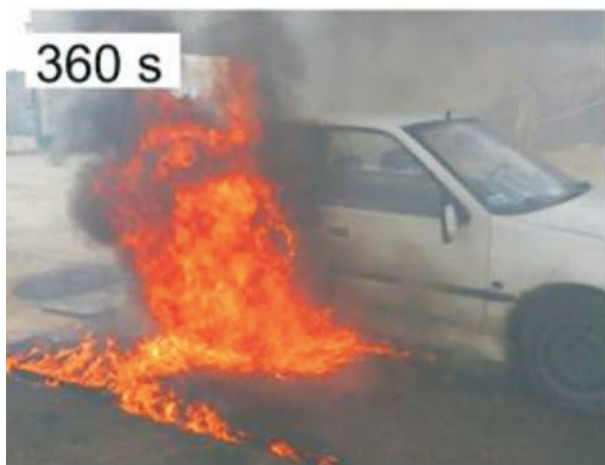
Rys. 8. Kolejne fazy pożaru samochodu stojącego na nawierzchni PERS nasączonej 20 litrami benzyny silnikowej (czas podany w sekundach)

W opinii osób obserwujących eksperyment, gdyby nawierzchnia poroelastyczna miała większą powierzchnię i paliwo nie wyciekło na nawierzchnię betonową, to prawdopodobnie pojazd nie uległby zapaleniu!