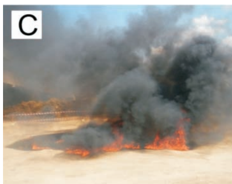
Rys. 5. Pożar paliwa rozlanego na betonowej nawierzchni drogowej A – kałuża powstała z rozlania 20 \text{ dm}^3 benzyny 95-oktanowej, B – pożar benzyny po 10. sekundach od zapłonu, C – pożar benzyny po 60. sekundach od zapłonu

swobodny przepływ powietrza i cieczy. Taka struktura nawierzchni ma wiele zalet, z których najważniejsze, to mniejszy hałas opon, znaczna poprawa przyczepności w warunkach intensywnych opadów oraz niemal całkowite wyeliminowanie zjawiska rozbryzgu wody przez koła samochodów jadących w czasie intensywnych opadów (rys. 6). Nawierzchnie drenażowe są stosowane coraz częściej w wielu krajach Europy oraz w Japonii i USA.