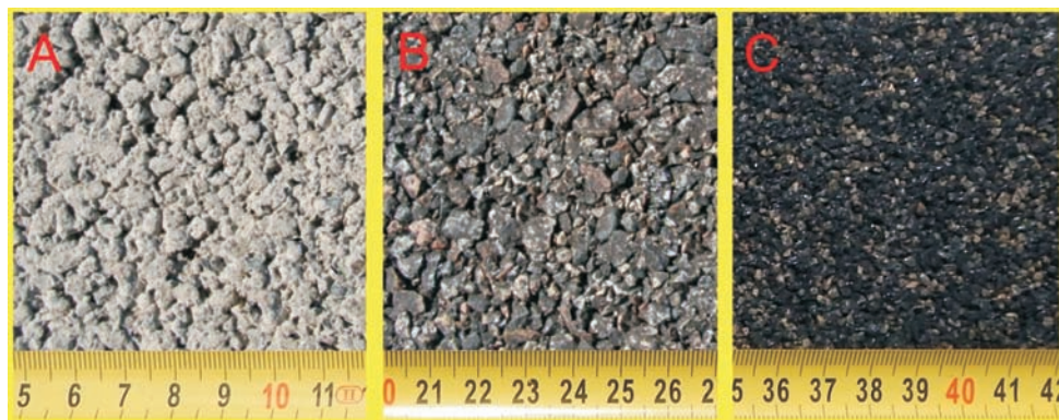
Rys. 7. Trzy typy nawierzchni porowatych A – porowaty beton cementowy, B – porowaty beton asfaltowy, C – nawierzchnia poroelastyczna (PERS)

Od kilku lat trwają intensywne prace nad nowym typem nawierzchni drenazowych nazwanym PERS. W nawierzchniach tych zamiast lepiszcza asfaltowego lub cementowego wykorzystywane są żywice poliuretanowe, a część granulatu mineralnego zastąpiona jest granulatem gumowym. W rezultacie uzyskiwana jest nawierzchnia porowata o dużej elastyczności. Na rys. 7 przedstawiono nawierzchnie drenazowe z lepiszczem cementowym (A), bitumicznym (B), oraz nawierzchnię poroelastyczną (C).