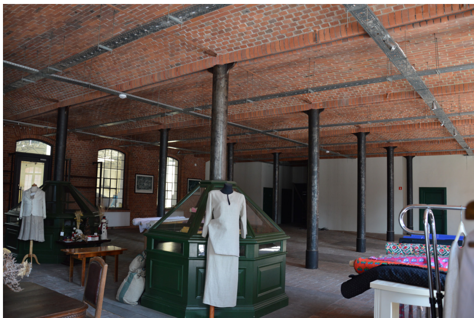
Fot. 4 Ekspozycja przedstawiająca historyczne wyposażenie i produkty fabryk lniarskich w Żyrardowie