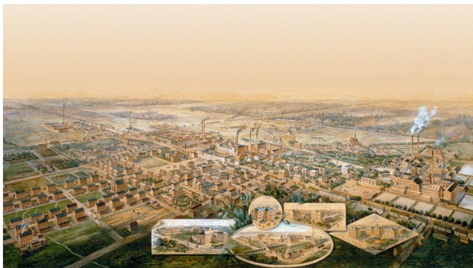
Fot. 3 Zespół fabryczno-mieszkaniowy w Żyrardowie powinien być elementem międzynarodowego wpisu seryjnego XIX-wiecznych zespołów fabryczno-mieszkaniowych