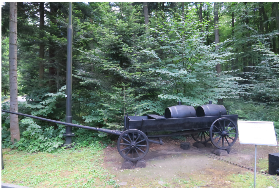
Fot. 5 Kopalnia Ropy Naftowej w Bóbrce powinna być elementem międzynarodowego wpisu seryjnego pierwszych miejsc przemysłowego wydobycia i przeróbki ropy naftowej