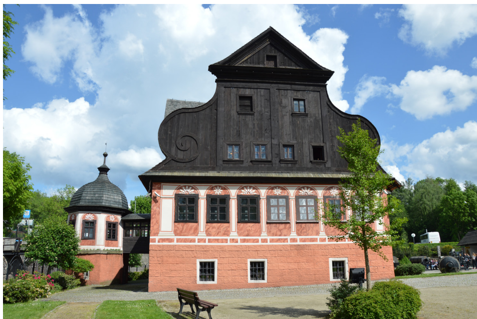
Fot. 1 Muzeum Papiernictwa w Dusznikach-Zdrój jest liderem konsorcjum przygotowującego międzynarodowy wpis seryjny europejskich młynów papierniczych