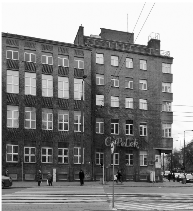
il. 1. Szkoła Pielęgniarek / The School for Nurses