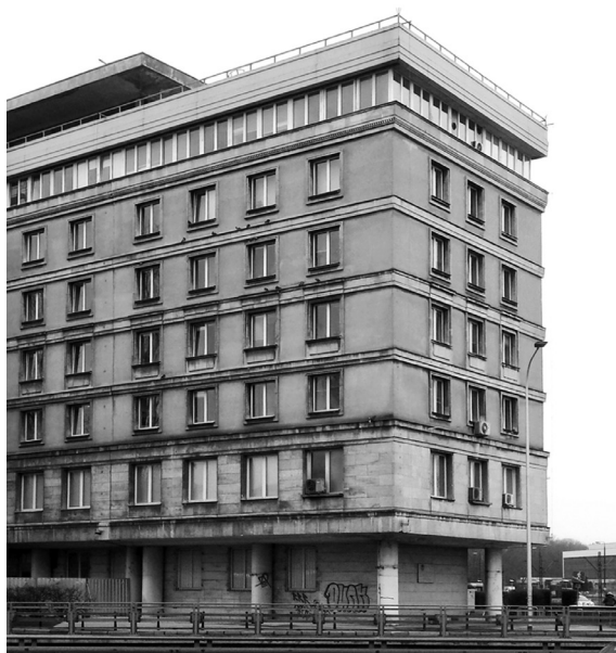
il. 2. Główny Urząd Statystyczny / Central Statistical Office

Potężne, pionowe rozcięcie w masywie to przeszklona klatka schodowa, która znakomicie rozgrywa wizualnie dwa łączące ją skrzydła. Otworowanie jednego skrzydła jest spokojne, zaś w kontraście, po drugiej stronie klatki schodowej, mamy do czynienia z niezwykle rzeźbioną i tektoniczną formą. Całe kolumny schodkowań, potężne ceglane uskoki, stają się niejako pretekstem dla narożnych okien, mocno kontrastujących z materialnością i masą pofałdowanej skóry budynku. Zabieg ten ma nie tylko plastyczne walory pełnego dynamizmu obserwacji z różnych perspektyw, ale także lepsze doświetlenie pomieszczeń. W ten sposób Gutt godzi ogień z wodą – potężną masę ściany z ażurem i światłem niezbędnym do prawidłowego funkcjonowania instytucji szkoły.