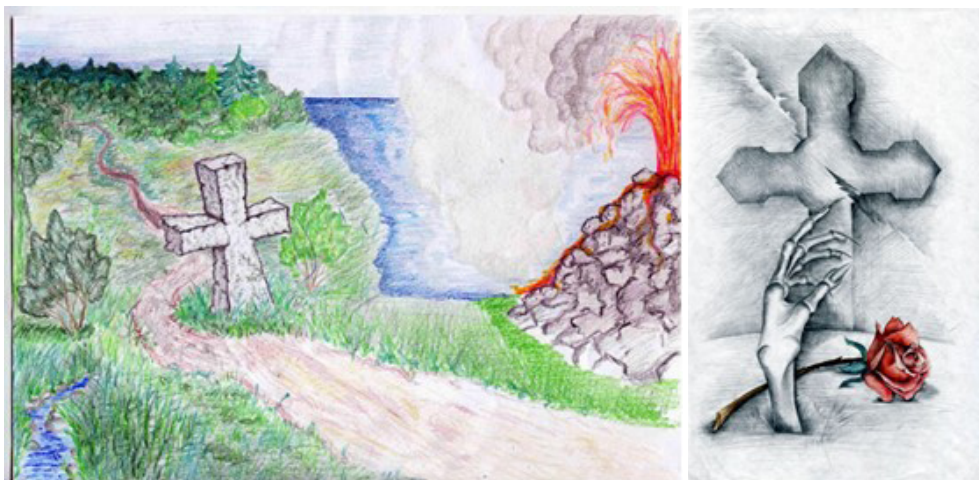
Рис. 3-4. Дорога мого життя