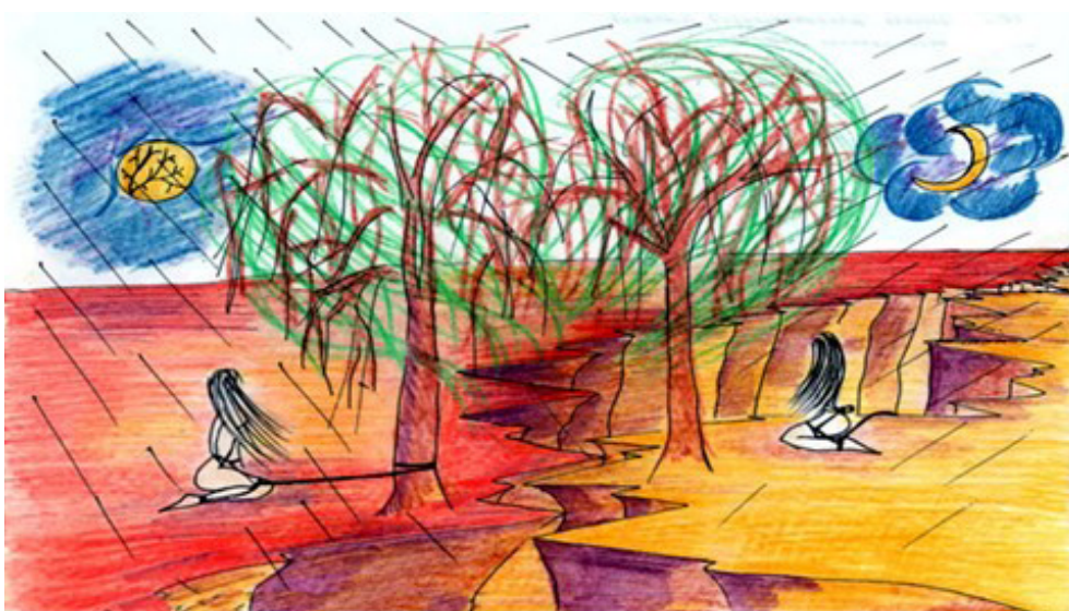
Рис. 5. Криза мого життя