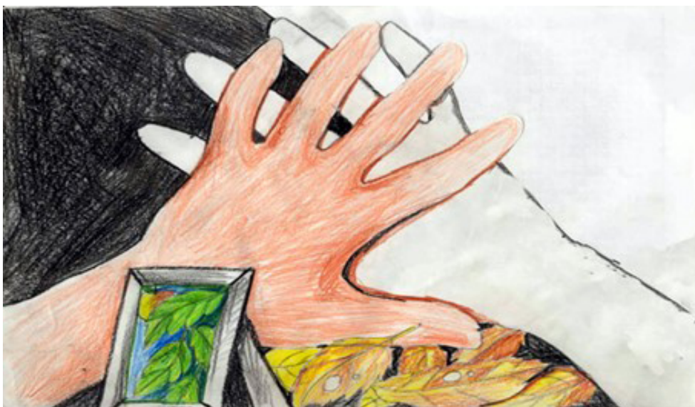
Рис. 11-12. Минуле, яке не можна виправити

В проведеному порівняльному аналізі психологічної продукції учасників активного соціально-психологічного навчання, таких як психомалюнки, казки про власне життя та самоаналізи, з використанням мотивів української народної пісні та художньої літератури, було виявлено наявність амбівалентних почуттів у суб'єктів. Зокрема, виявлені почуття любові – ненависті, щастя – смутку, задоволення – болю, які призводять до втрати енергії та психологічної імпотенції суб'єкта.