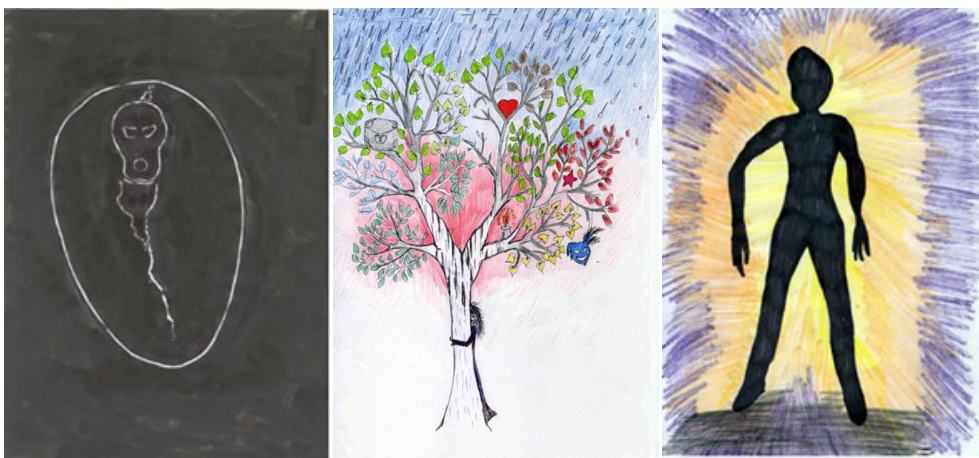
Рис. 1, 2. Драматична подія життя

Таким чином, феномен психологічної смерті може бути символічно відтворений у зображувальному мистецтві та символіці психомалюнків через різні сюжети страждань, насилля, агресії, жорстокості, руйнування, суїциду, нечистої сили та божественних образів. (рис. 1-12).