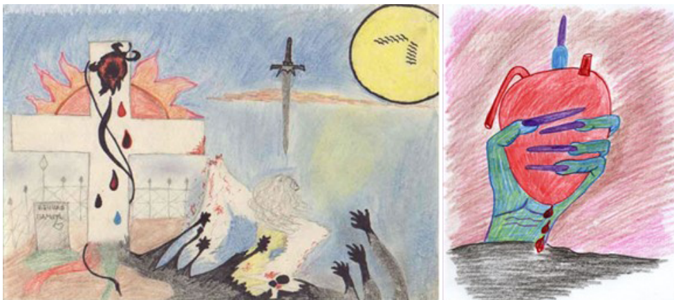
Рис. 9-10. Людина яка психологічно не існує