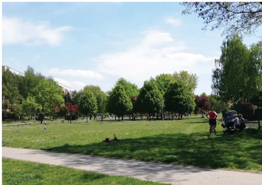
Rys. 3. Park na osiedlu Kurdwanów Nowy maj 2020

Wyróżniającą się i najbardziej docenianą przestrzenią zieloną jest ponad 5-hektarowy obszar parkowy. Każdego dnia czas spędza w nim wielu mieszkańców osiedla – są to głównie matki z dziećmi. W godzinach wieczornych oraz w dni wolne w parku przebywają spacerujący i ćwiczący na świeżym powietrzu dorośli 1 . Przeważająca większość