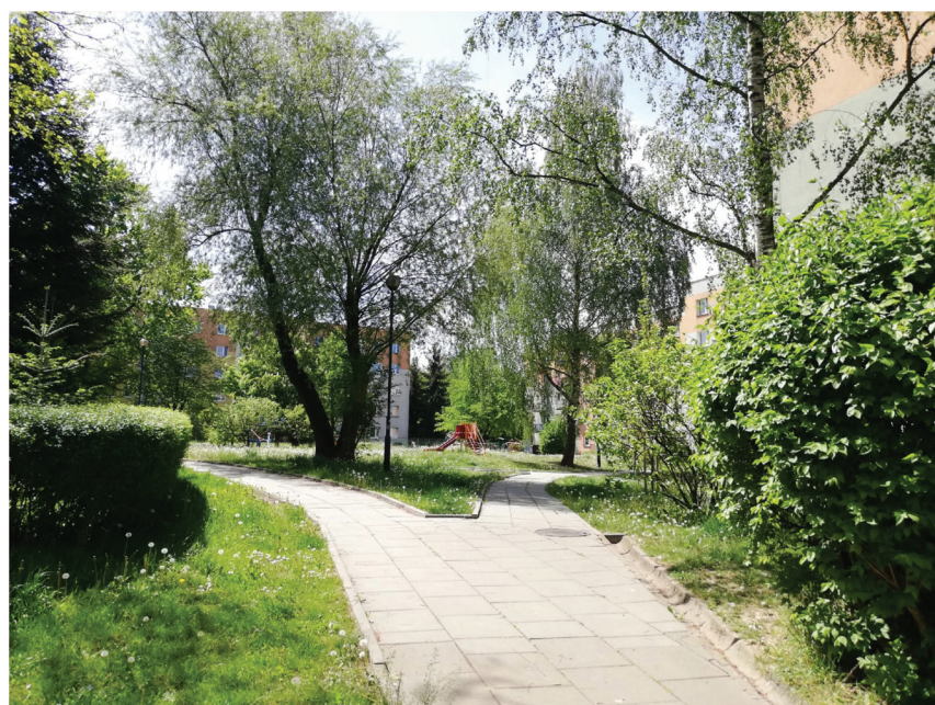
Rys. 4. Jeden z ogrodów dziecięcych na osiedlu Kurdwanów Nowy maj 2020

mieszkańców dalszych rejonów Krakowa nie wie o istnieniu tego miejsca w Kurdwanowie. Mimo dobrej komunikacji nie jest to miejsce ich weekendowej rekreacji czy cel spacerów. Nieliczni krakowianie słyszeli o corocznym festynie Jesień Kurdwanowa – nie wiążą go jednak z kurdwanowską zielenią 2 .