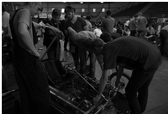
Rys. 3. Pojazd P16 podczas testu instalacji pneumatycznej w trakcie zawodów Aventics Pneumobile 2016 [1]