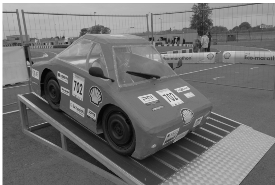
Rys. 1. Pojazd URB16 podczas testu sprawności hamulców w trakcie zawodów Shell Eco-marathon Le Mans 2016 [1]