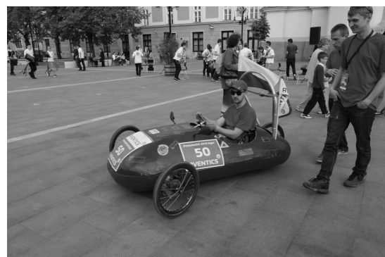
Rys. 4. Pojazd P16 podczas parady pojazdów w trakcie zawodów Aventics Pneumobile 2016 [1]