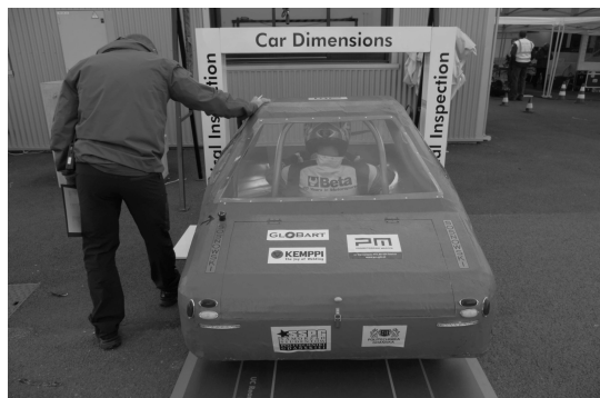
Rys. 2. Pojazd URB16 podczas testu wymiarów w trakcie zawodów Shell Eco-marathon Le Mans 2016 [1]