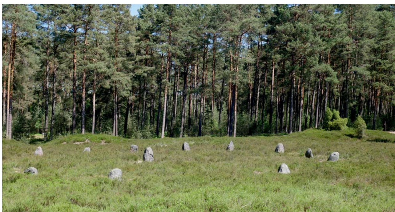
Ryc. 2. Krąg kamienny nr VIII w Rezerwacie Kregi Kamienne w Odrach Fig. 2. Stone circle No. VIII in the Stone Circle Reserve in Odry