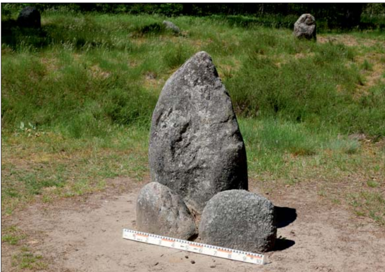
Ryc. 5. Wizerunek człowieka na steli w kręgu kamiennym nr V w Rezerwacie Kręgi Kamienne w Odrach Fig. 5. Image of a man on a stele in the stone circle No. V in the Stone Circle Reserve in Odry

postaci ludzkiej na kamieniu centralnym kręgu kamiennego w naszym kraju.