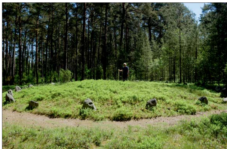
Ryc. 3. Krąg kamienny nr VI w Rezerwacie Kregi Kamienne w Odrach Fig. 3. Stone circle No. VI in the Stone Circles Reserve in Odry

które mają cechy obróbki kamieniarskiej. Najważniejszy jest krąg określany mianem kręgu V. W jego centrum stoi duży głaz typu stela o wysokości 1,3 m, nosi on ślady wyraźnej obróbki. Jego ściana zachodnia jest wygładzona, a boki – północny i południowy – mają ostre krawędzie. W czasie wykonywania pomiarów i dokumentacji fotograficznej dokonano wyjątkowego, nieopisanego dotąd odkrycia. Około godziny 12:15 w dniu przesilenia letniego, patrząc na kamień centralny od strony wschodniej, na jego powierzchni pojawia się cień delikatnego reliefu. Cień ten wraz z reliefem tworzy zarys sylwetki kłęczącego człowieka w pozie wskazującej na składanie ofiary bogom (ryc. 5). Odkrycie to zostało potwierdzone w sezonach badawczych: 2017, 2018 i 2019 (Ruszkowski, 2019a). Jest to pierwszy, wyraźny wizerunek