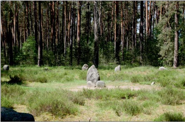
Ryc. 4. Stela w kręgu kamiennym nr V w Rezerwacie Kręgi Kamienne w Odrach Fig. 4. Stele of the stone circle No. V in the Stone Circle Reserve in Odry