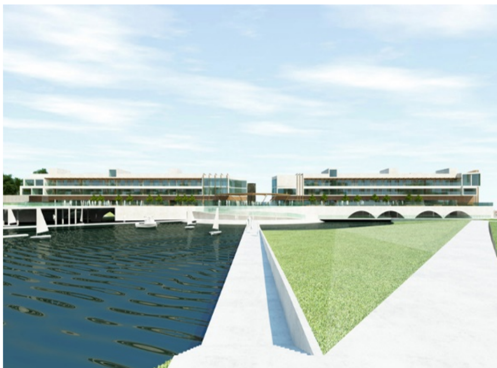
Ryc. 4. Dyplom magisterski: Zespół mieszkaniowo-usługowy w Kazimierzy Wielkiej. Widok na elewację południowo - zachodnią kompleksu.

Bryła budynku jest silnie zgeometryzowana. O jej rozróżnieniu horyzontalnym decydują kolejne kondygnacje przesunięte względem siebie, dzięki którym powstały tarasy dostępne z mieszkań prywatnych. Obiekt otwiera się w kierunkach przestrzeni zielonych i miasta. Skierowanie środka ciężkości bryły na poziom placu głównego oraz zaakcentowanie go poprzez kierunki ramp spacerowych podkreślają jego rolę. Odpowiednie ukształtowanie bryły budynku sprawia, że człowiek znajdujący się na placu odnosi wrażenie uczestniczenia zarówno w przestrzeni obiektu, placu, jak i naturalnego krajobrazu. Przestrzeń publiczna integruje projektowane założenie, stając się jednym z punktów w ciągu przestrzeni ogólnodostępnych w Kazimierzy Wielkiej, w tym rynku głównego, parku miejskiego, terenu Cukrowni, przy założeniu rewitalizacji dawnego zakładu „Łubna”.