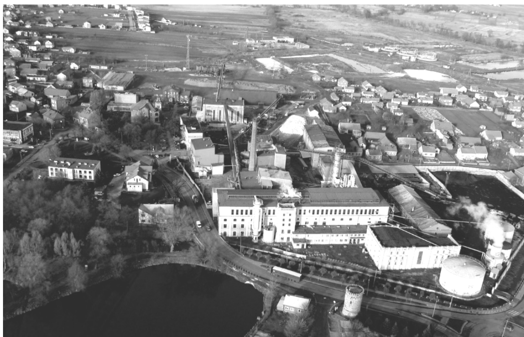
Ryc. 1. Dyplom magisterski: Zespół mieszkaniowo-usługowy w Kazimierzy Wielkiej . Widok na projektowany kompleks z lotu ptaka.

Przykładem obrazującym trafność określenia myślenie projektujące [5, s. 202] w odniesieniu do kształtu funkcjonalno- przestrzennego Kazimierzy Wielkiej jest wizja rodziny Łubieńskich. Dotyczyła ona założenia w mieście Cukrowni „Łubna” [9]. Idea stworzenia zakładu przemysłu spożywczego poparta zastanymi walorami: żyznymi terenami pod uprawy rolnicze, dogodną komunikacją z regionem, wykwalifikowaną kadrą ludzką chętną do pracy, zaowocowała powstaniem Cukrowni. Pomimo niesprzyjających warunków ekonomicznych założycielom udało się wykorzystać istniejący potencjał ludzki oraz możliwości lokalizacyjne. Cukrownia wpłynęła na dalsze losy i dynamiczny rozwój miasta oraz najbliższych terenów.