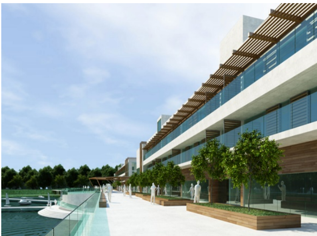
Ryc. 3. Dyplom magisterski: Zespół mieszkaniowo-usługowy w Kazimierzy Wielkiej . Widok z poziomu placu w kierunku parku miejskiego.

Wybór lokalizacji działki dla projektowanego zespołu mieszkaniowo-usługowego nie był przypadkowy. Zakres opracowania obejmuje atrakcyjny teren z kompleksem sztucznych zalewów bezpośrednio przylegający do miejskiego parku 6 . Obszar w obecnym stanie, pomimo ogromnych walorów przyrodniczo-krajobrazowych jest miejscem zaniedbanym, w którym brak koncepcji zagospodarowania. W pobliżu znajdują się: rynek główny, zbiornik retencyjny na rzece Małyszówce oraz ośrodki sportowe: basen i hala sportowa. Na północny-zachód od zalewów znajduje się teren dzisiaj już niefunkcjonującej Cukrowni „Łubnej”, która przez lata stanowiła siłę napędową miasta.