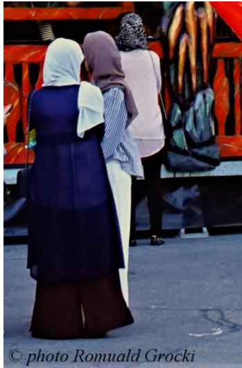
Rysunek 1. Typowy ubiór kobiety muzułmańskiej

Będąc w temacie praw kobiet trzeba poruszyć wątek zakrycia ciała kobiety, ponieważ każdy kto zna zasady islamu tylko z mass mediów twierdzi, że jest to nieodłączna część życia kobiety. Koran mówi o tym w sposób bardzo prosty: kobieta, kiedy się modli zwraca się bezpośrednio do Boga, powinna zatem zakryć głowę i ubrać coś, co nie uwidacznia jej kształtów.