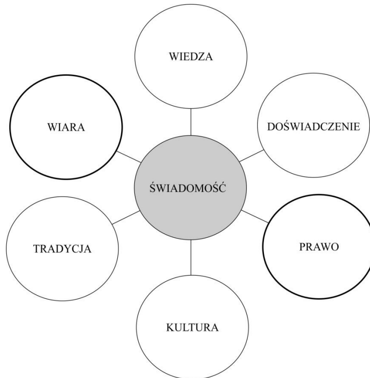
Rysunek 2. Źródła świadomości