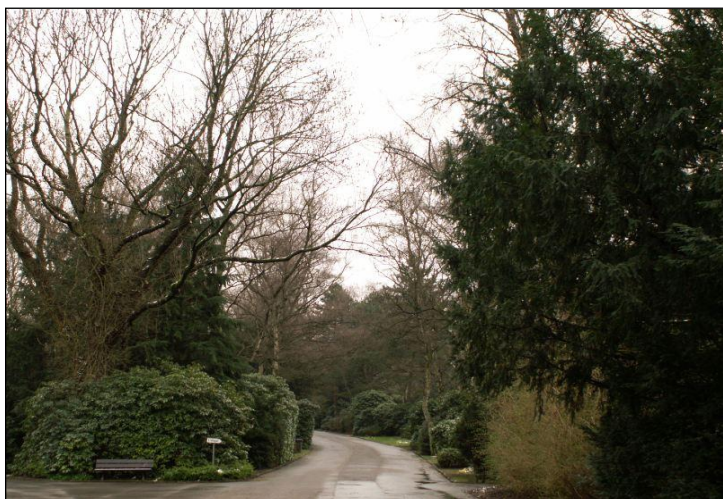
Fot. 1. Cmentarz Główny w Dortmundzie. Photo. 1. Central Cemetery in Dortmund.

sposób nie zakłóca specyficznej atmosfery cmentarzy. Na terenie rozległego założenia Cmentarza Głównego wzdłuż ścieżek rozmieszczone są tablice ze zdjęciami i podpisami dostarczającymi informacje na temat fauny i flory, jaką można tam zaobserwować – pełni więc dodatkowo funkcję dydaktyczną. Tablicę informacyjną dotyczącą avifauny spotkamy również na Cmentarzu Północnym. Położony w środku dzielnicy stanowi także „drogę na skróty” dla mieszkańców chcących się szybciej przemieścić z jednej strony osiedla na drugą. Bogata zimozielona roślinność (złożona głównie z różaneczników ( Rhododendron sp ) sprawia, że miejsca te są również atrakcyjne w okresie poza letnim (fot. 1, 2).