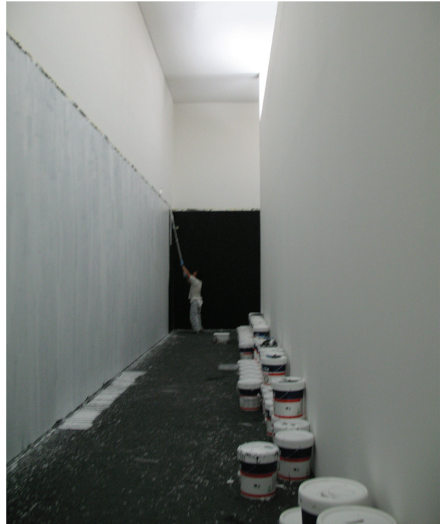
Il. 8. Transformacja: Museum as Performance, Serralves Museum of Contemporary Art, Porto, arch. Alvaro Siza

Fig. 7. Formation: David and Goliath, Parc de Les Cascades, Barcelona, art. Antoni Llena