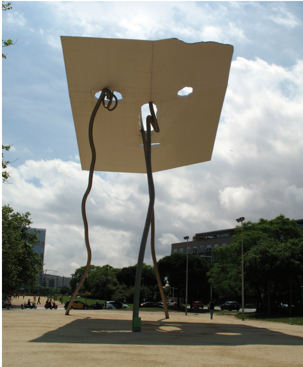
Il. 7. Formacja: David and Goliath, Parc de Les Cascades, Barcelona, art. Antoni Llena

Fig. 7. Formation: David and Goliath, Parc de Les Cascades, Barcelona, art. Antoni Llena