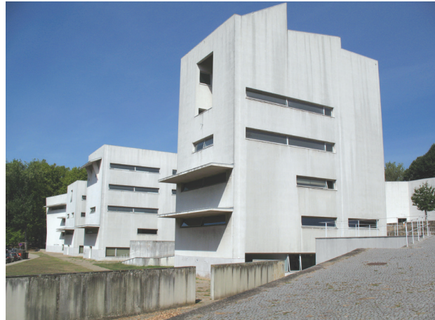
Il. 6. Fragmentaryczność: Faculdade de Arquitectura da Universidade do Porto, Porto, arch. Alvaro Siza