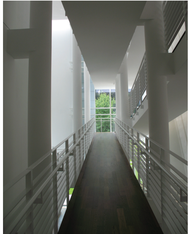
II. 2. Powtarzalność: Museum Frieder Burda, Baden-Baden, arch. Richard Meier

Fig. 1. Originality: Casa da Música, Porto, arch. Rem Koolhaas