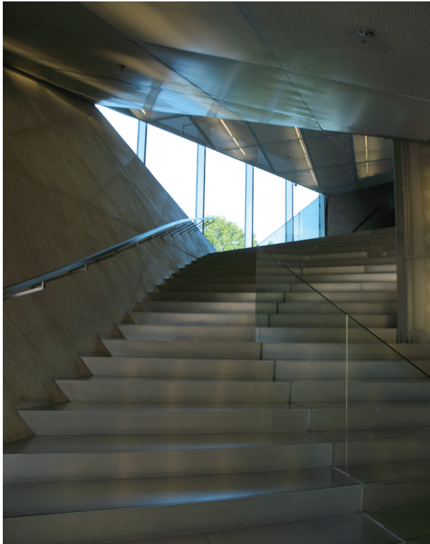
II. 1. Oryginalność: Casa da Música, Porto, arch. Rem Koolhaas

Fig. 1. Originality: Casa da Música, Porto, arch. Rem Koolhaas