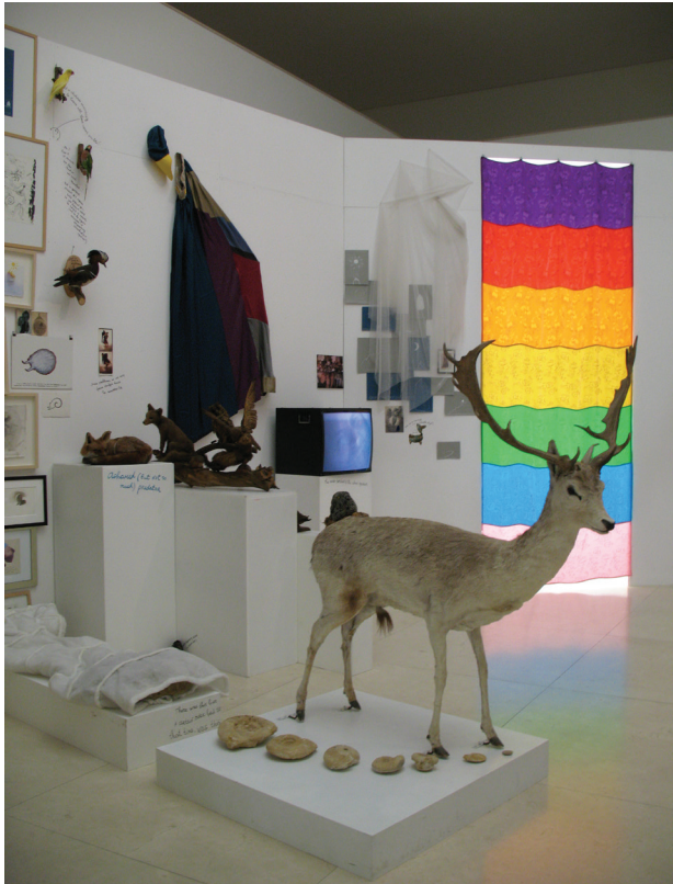
Il. 3. Materialność: Serralves Museum of Contemporary Art, Porto, arch. Alvaro Siza