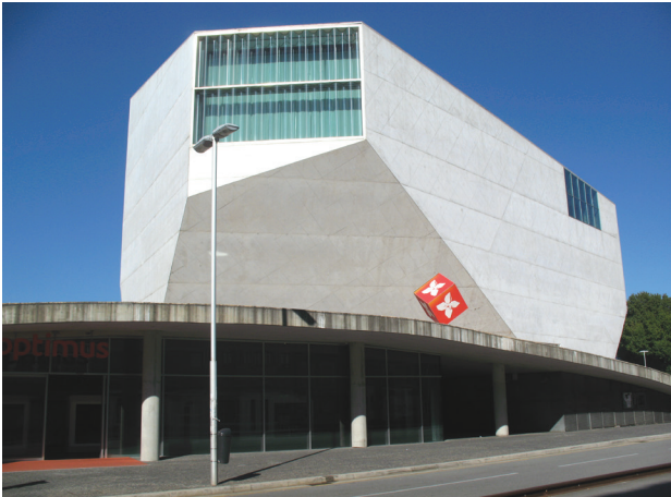
Il. 5. Kompleksowość: Casa da Música, Porto, arch. Rem Koolhaas (fot. A. Kwiatkowska)