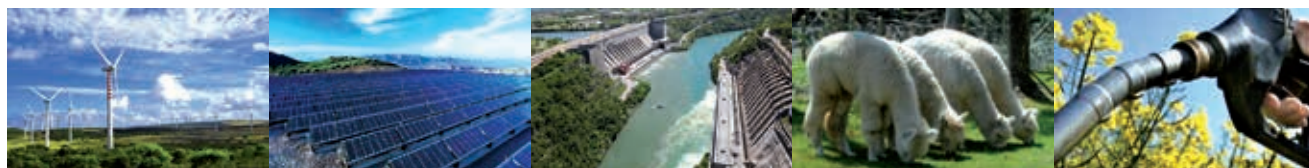
Rys. 1. Alternatywne źródła energii (elektrownie wiatrowe, solarne, wodne), biomasa [3]

Bardzo często stosuje się metody opierające się na chemicznych modyfikacjach. Wykonuje się więc na przykład: estryfikacje, hydrolizy, pirolizy lub reakcje odwrotne czyli polimeryzacje, polikondensacje itd. Estry są to związki zawierające funkcjonalną grupę estrową – COO –, która jest związana z dwóch stron z grupą organiczną (R-COO-R 1 ), powstałe w wyniku reakcji estryfikacji najczęściej kwasu karboksylowego i alkoholu przy użyciu katalizatora np. kwasu siarkowego (Rys. 2). Na drodze reakcji estryfikacji otrzymuje się często modyfikowaną celulozę, którą dalej wykorzystuje się jako superabsorber w aplikacjach kosmetycznych, pieluchach etc.