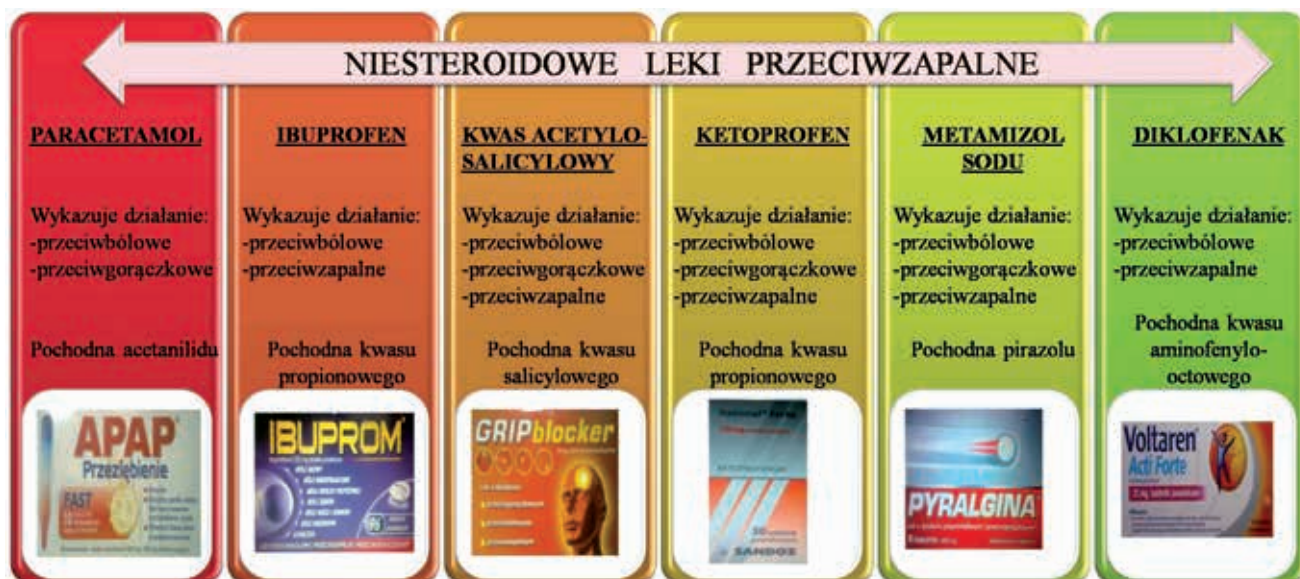
Rys. 1. Charakterystyka popularnych medykamentów [13]

może świadczyć o ich skuteczności [11] oraz zróżnicowanej aktywności przeciwbólowej, przeciwgorączkowej i przeciwzapalnej [12]. Do najbardziej popularnych NLPZ zaliczamy m.in. diklofenak, ketoprofen, kwas acetylosalicylowy, ibuprofen, naproxen [10]. Charakterystykę niektórych z nich przedstawia rys. 1.