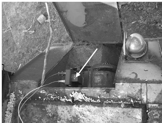
Rys. 1. Widok przetwornika zamontowanego na kombajnie zbożowym BIZON Fig. 1. View of the converter mounted on BIZON combine harvester

Dodatkowo, na końcu wału dolnego przenośnika, może być zamontowany czujnik kąta obrotu, pozwalający zmierzyć i zarejestrować rzeczywistą prędkość wału.