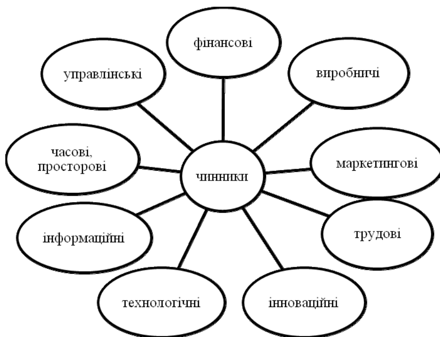
Рис. 2. Внутрішні чинники впливу на процес формування організаційно-економічного механізму щодо розвитку підприємств зовнішньоекономічної діяльності

Fig. 2. Internal factors of influence on the process of organizational and economic mechanism for the development of foreign economic activity of enterprises