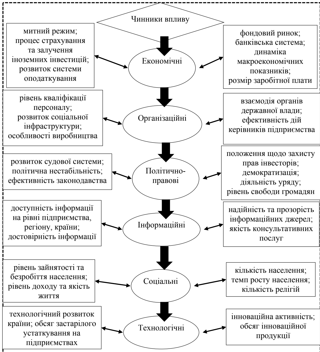
Рис. 1. Зовнішні чинники впливу на процес залучення іноземних інвестицій промисловими підприємствами

канали постачання; конкуренти – кількість конкурентів на ринку, рівень та прозорість конкурентної боротьби; споживачі – попит на продукцію, платоспроможність покупців, задоволення інтересів шляхом підвищення якості та реалізації інноваційної продукції, ціна на вироблену продукцію.