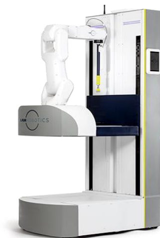
Rys. 2. Mobilny robot do kompletowania zamówień w magazynie (IAM Robotics)

Współcześnie automatyzacja procesów produkcyjnych, magazynowych, czy też inwentaryzacyjnych staje się konieczna, jeśli tylko liczba i skala wykonywanych operacji uzasadnia ekonomikę inwestycji, lub gdy brak automatyzacji zagraża przekroczeniem dopuszczalnego ze względów biznesowych poziomu błędów i ryzyka. Wskutek tego w nowoczesnych przedsiębiorstwach automatyzacja staje się standardem w coraz liczniejszych procesach logistycznych. Przyczyną takiego stanu rzeczy jest rosnąca presja na obniżanie cen produktów i usług, a wobec tego na jednostkowe koszty logistyczne.