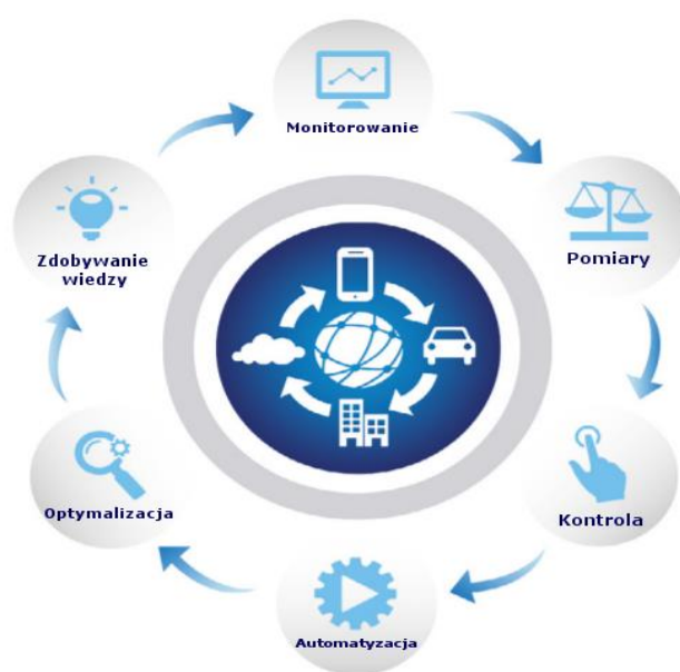
Rys. 2. Korzyści z wdrożenia rozwiązań opartych na technologii Internetu rzeczy. Opracowanie własne na podstawie: Macaulay, Buckalew, Chung, 2015

Jeśli chodzi o sztuczną inteligencję, do głównych korzyści płynących z jej zastosowania w obszarze logistyki można zaliczyć (Macaulay, Buckalew, Chung, 2015):