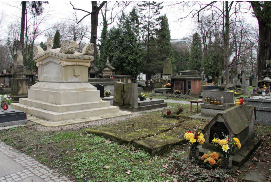
Fot. 3. Skromny grób Katarzyny Wysockiej. W tle sarkofag męża