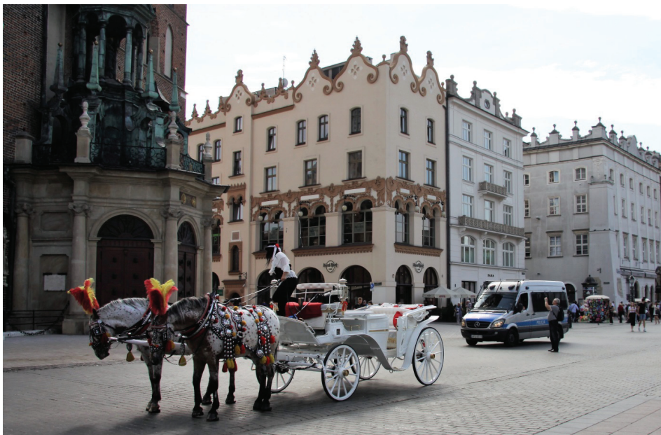
Fot. 1. Kraków, Rynek Główny 5: kamienica Bidermanowska (środkowa)