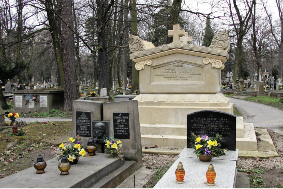
Fot. 2. Jeden z najokazalszych obiektów rakowickiej nekropolii – grobowiec Tomasza Wysockiego (kwatery 5)