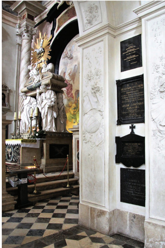
Fot. 5. Filar w Kolegiacie Uniwersyteckiej św. Anny w Krakowie na którym znajduje się tablica poświęcona braciom Wysockim