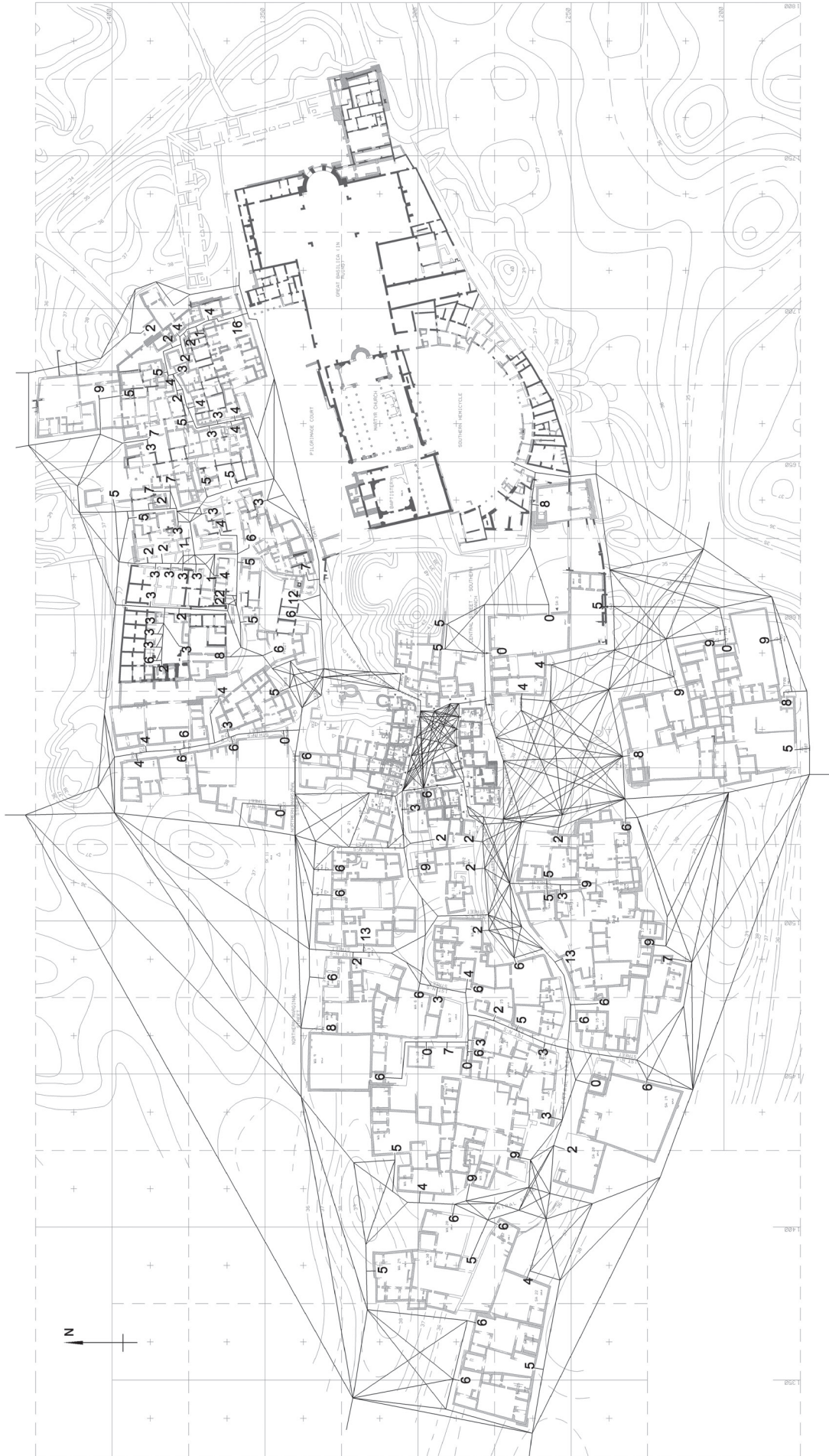
II. 5. Siatka połączeń komunikacyjnych dla hipotezy I (oprac. J. Kościuk) Fig. 5. Network of pedestrian connections for hypothesis I (drawn by J. Kościuk)