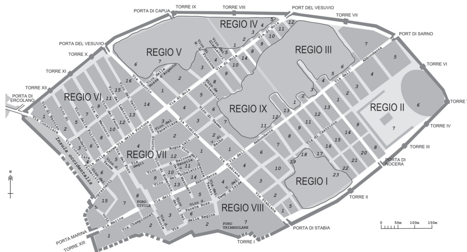
Fig. 1. Pompeii