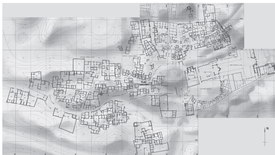
Fig. 2. Early medieval settlement in Abû Mînâ (drawn by J. Kościuk)

cały kontekst historyczny, a przede wszystkim zerwanie przez Egipt bezpośredniej kulturowej łączności z Bizancjum od połowy VII w., takie stwierdzenie może być tym bardziej stosowne w odniesieniu do wczesnośredniowiecznego osiedla w Abû Mînâ.