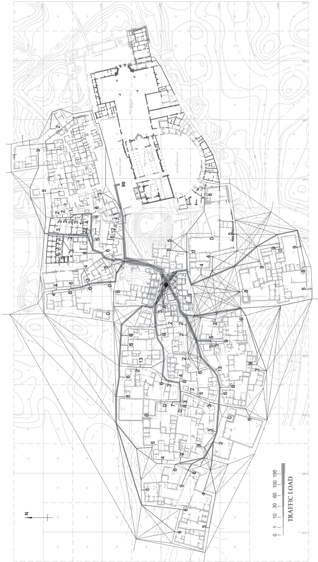
Il. 10. Wyniki symulacji dla hipotezy III. Grubość linii obrazuje symulowane potoki ruchu na poszczególnych ciągach komunikacyjnych (oprac. J. Cichocka)

Fig. 10. The results of the simulation for hypothesis III. The thickness of the line demonstrates the simulated flows of traffic in individual pedestrian connections (drawn by J. Cichocka)