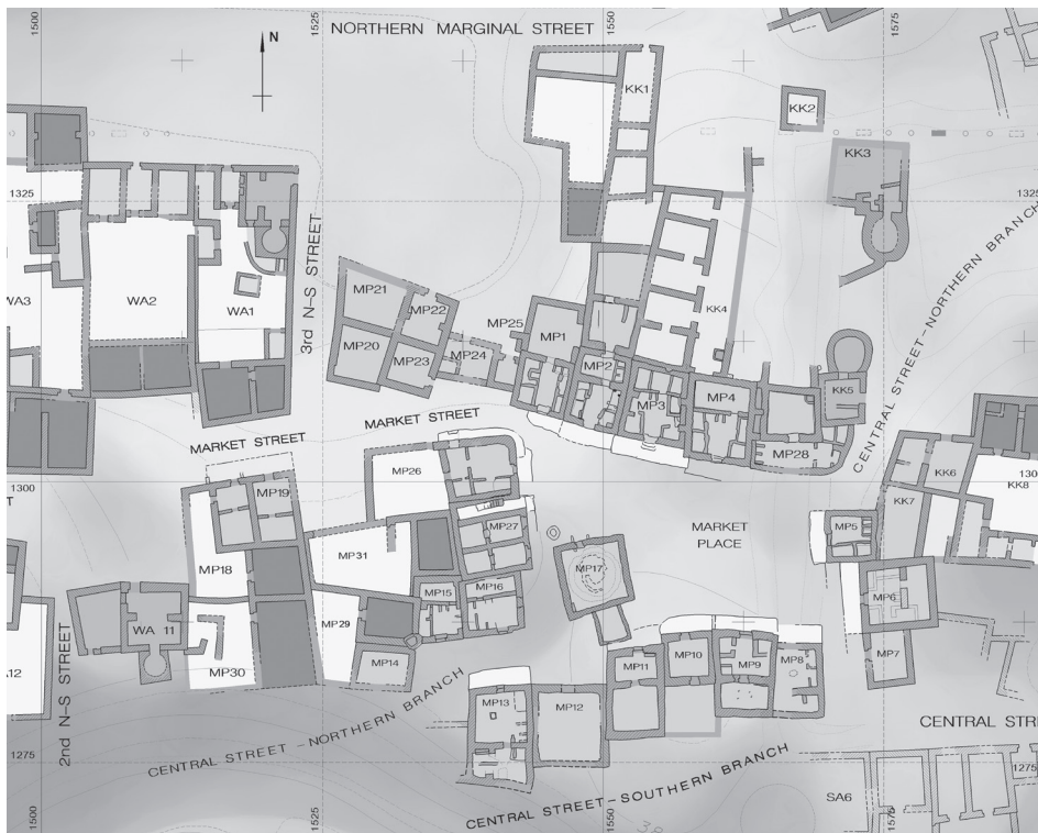
Il. 3. Plac Targowy w Abû Mîna (oprac. J. Kościuk)