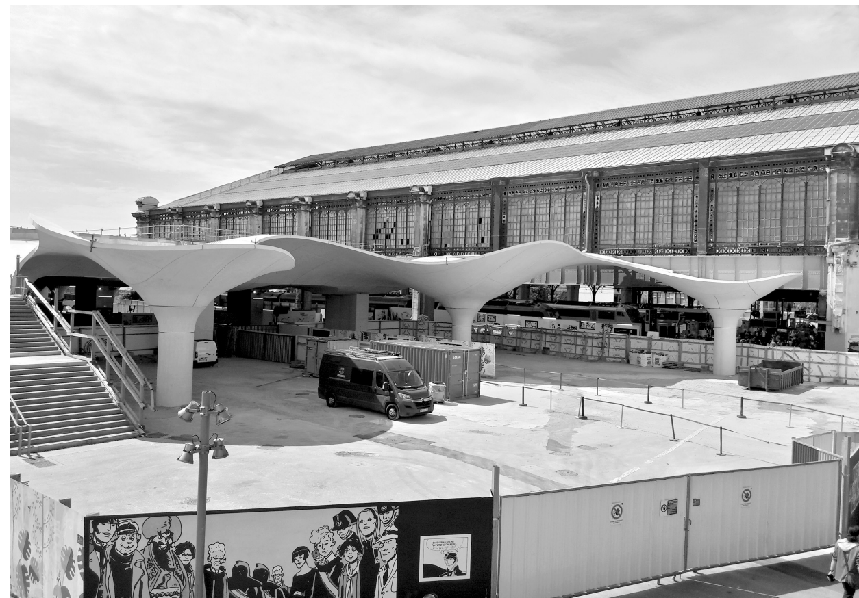
Il. 5. Fragment rozbudowywanego dworca Austerlitz o nowe perony. A fragment of the Gare d'Austerlitz that is being expanded through the addition of additional terminals.

The new-old building of the Halle Freyssinet changed its name, becoming Station F—the largest start-up incubator in the world—opened for use on the 29th of June 2017. It features 34000 square metres of usable floor area, over 3000 workstations, as well as a food court including a restaurant and three bars, in addition to an auditorium for 370 people. The building was divided into 3 zones: Creation, Work and Sharing, in addition to being supplemented with a relaxation space.