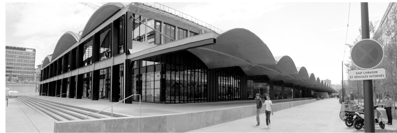
Il. 6. Station F – Halle Freyssinet. / Station F – Halle Freyssinet.

The development project of the Gare d'Austerlitz zone is, overall, composed of two elements. The first is the building of the train station that is under the supervision of SNCF, while the second is composed of the surroundings of the station, which are being redeveloped by the SEMAPA company in the name of the city, in addition to the entirety of the Paris-Rive-Gauche area. The eastern zone of the Gare d'Austerlitz, between the train station hall and Boulevard de l'Hopital, however, is in for a true revolution. The IlotA7A8, which is the name given to this exceptional project, is an immense multi-functional node with a floor area of almost 80000 m 2 . As a part of a cooperation between SEMAPA and SNCF—Jean Nouvel, Jean-Marie Duthilleul and Michel Desvigne created a spatial development plan and prepared a feasibility study for this monumental complex. The IlotA7A8 project is meant to include a complex of underground parking lots, while its ground floor zone will feature