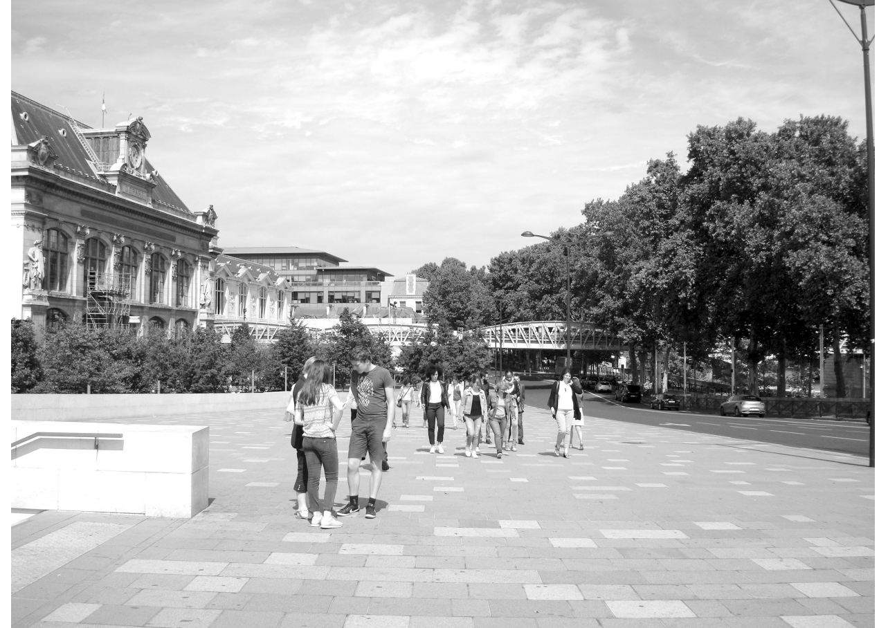
Il. 4. Fragment przestrzeni publicznej zrealizowanej między dworcem a nabrzeżem Sekwany. Fot. Autora Ill. 4. Authors archive. Fragment of the public space built between the train station and the Seine waterfront. Authors archive