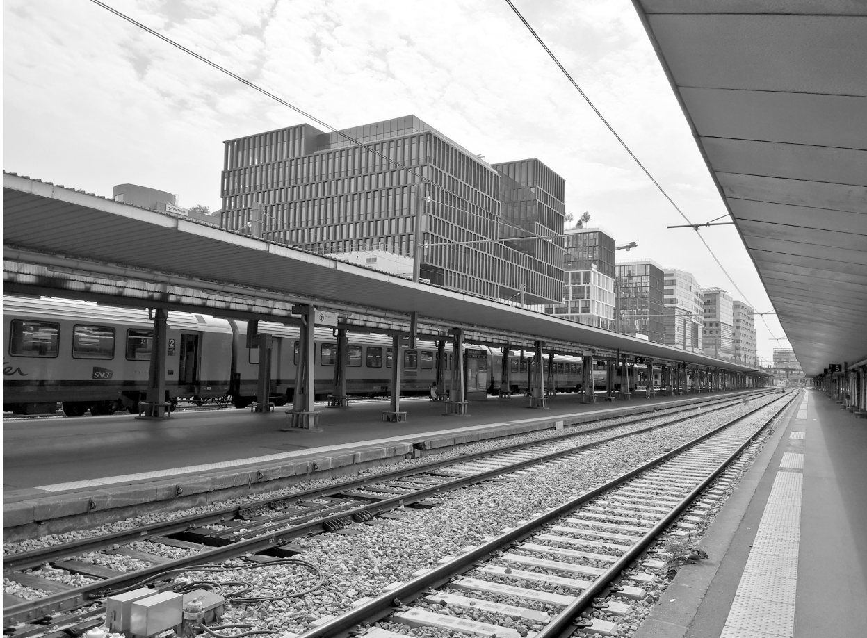
Il. 3. Widok na zespół zabudowy biurowej realizowanej bezpośrednio nad przebiegiem nowych torów i peronów dworca Austerlitz. Fot. Autora Ill. 3. Authors archive. View of the complex of office buildings located directly above the new railway tracks and terminals of the Gare d'Austerlitz. Authors archive