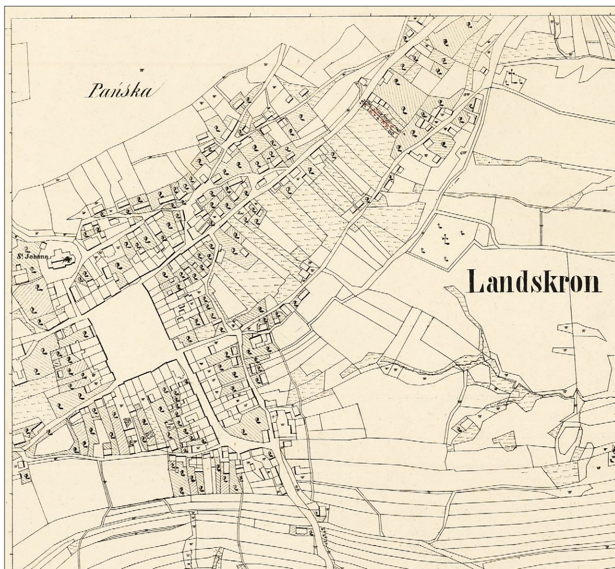
Ryc. 1. Mapa katastralna Lanckorony z 1845; Archiwum Państwowe w Krakowie.

Since the fourteenth century until the fall of the Polish-Lithuanian Commonwealth, the castle was the seat of local authorities. In 1770–1772, it became one of the defensive fortresses during the so-called Bar Con-