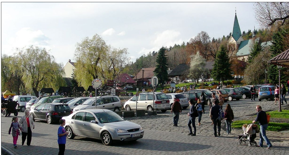
Ryc. 6. Rynek w niedzielę.