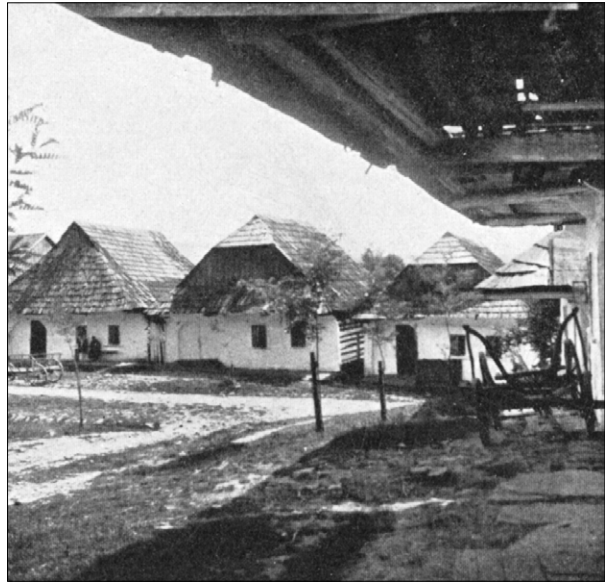
Ryc. 2. Widok z pierzei zachodniej rynku na pierzeję południową, domy z dachami przyczółkowo-naczółkowymi rozdzielone miedzuchami; na pierwszym planie dom z przedprożem, widoczny podwyższony poziom nawierzchni; fot. B. Treter, według: H. Jasieński, op. cit., s. 337, il. 216.

Upływ czasu powodował sukcesywne, lecz znaczące zmiany, bezpowrotnie zniekształcające ów unikatowy układ turbinowy. Pokazują to zachowane plany: wspomniany z końca XVIII wieku i katastralny z roku 1845. W narożu północno-zachodnim poszerzono miedzuch i wytyczono drogę (dziś ul. Kazimierza Wielkiego) do pobliskiego zespołu dworskie-