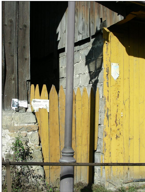
Ryc. 5. Dom przy ul. Świętokrzyskiej 7/109 (wpisany do Ewidencji Gminnej jako „drewniany o konstrukcji zrębowej, z 2 poł. XIX wieku, przebudowany”); widoczna ściana boczna z bloczków żużlobetonowych i pierwotne oszalowanie ściany frontowej ze znakiem tzw. błękitnej tarczy i z napisem „Zabytek chroniony prawem”; dom rozebrano rok temu; fot. T. Węclawowicz 2019.

Z drugiej strony ów zwrot ku przeszłości zaczął ciążyć. „Wśród miasta samego – a wsi dzisiejszej – Lanckorony zostawiła przeszłość pamiątkę innego rodzaju” – czytamy w Odezwie TPL. „To chałupy o kształcie osobliwym, przenoszącym myśl w te czasy, kiedy świeżo kreowane miasto [...] byt swój opierać zaczęło – prócz rolnictwa – także na rzemiośle i kupiectwie. [...] Zespół bowiem lanckorońskich chałup – wyjątkowo dobrze do dziś zachowany – jest rzadkością [...]. Chronić je tedy trzeba i przed zębem czasu i przed – groźniejszą jeszcze – niechęcią właścicieli do tradycji, tej tradycji, co przetrwała – bez nacisku z zewnątrz – tyle wieków”. Przywołana niechęć do tradycji była konsekwencją wymogów konserwatorskich, nakazujących ściśle zachowanie zabytków, co uniemożliwiło jakąkolwiek adaptację domów do zmieniających się własnych potrzeb i oczekiwań turystów 15 . TPL zdawało sobie sprawę, że „utrzymanie lanckorońskiej chałupy w jej stylowym charakterze (zwłaszcza krycie dachu