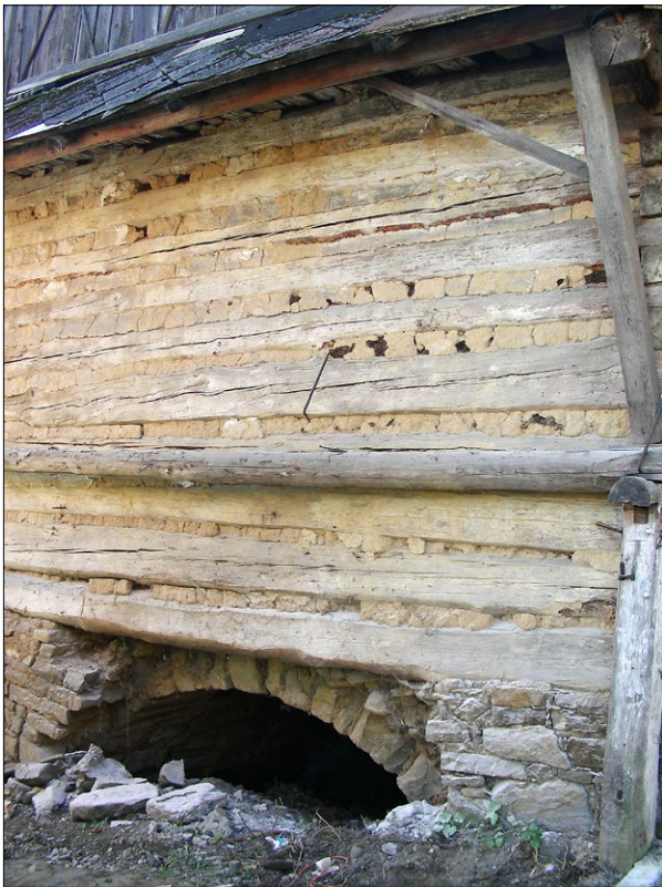
Ryc. 4. Dom przy ul. Świętokrzyskiej 92 w trakcie remontu ściany bocznej, widoczne kamienne sklepienie piwnicy; fot. T. Węclawowicz 2016.

Fig. 4. House at 92 Świętokrzyska Street, a fragment of a stone cellar vault seen during renovation of the wooden side wall; photo by T. Węclawowicz 2016.