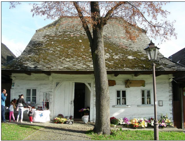
Ryc. 3. Rynek, dom nr 3/139 w pierzei wschodniej (wpis do Ewidencji Gminnej nr 66), dach przyczółkowo-naczółkowy kryty eternitem; fot. T. Węclawowicz 2019.