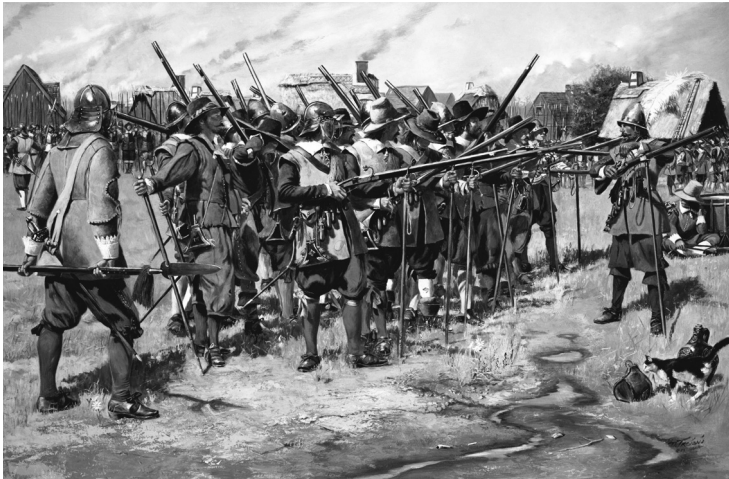
Rysunek 2. Don Troiani, The First Muster.

złożonych ze zwykłych, lecz uzbrojonych obywateli, którzy przechodzili podstawowe przeszkolenie wojskowe, aby być przygotowanym do walki na wypadek konfliktu. Chronili oni samych siebie i swoje rodziny przed zagrożeniami związanymi z atakami prowadzonymi przez Indian, przed obcymi najeźdźcami, zaś w późniejszym czasie odegrały decydującą rolę w wojnie o niepodległość Stanów Zjednoczonych. Z powodu roli, jaką oddziały milicyjne odegrały w narodzinach i rozwoju narodu amerykańskiego, prawo stanów do utworzenia, utrzymywania i zatrudniania własnych sił milicyjnych jest gwarantowane przez amerykańską konstytucję oraz konstytucje i statuty poszczególnych stanów 11 .