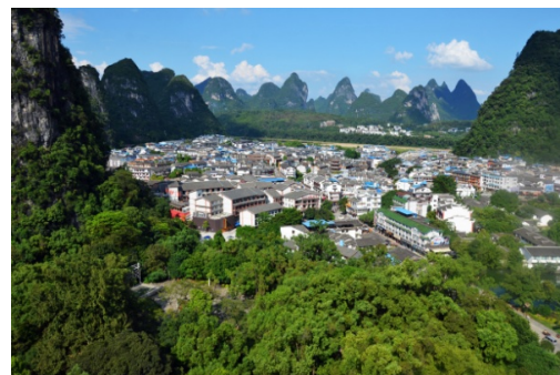
Ryc. 6 b Yangshuo. Widok w kierunku rzeki Li, lokalizacja miasta na śródgórskiej płaszczynie brzegowej.

Fig. 6 a Yangshuo. The Northern Gate - the Li river flowing into the vicinity of the city.