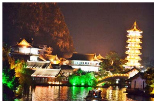
Ryc. 2b Guilin. Skraj miasta lokacyjnego. Spontaniczna kompozycja elementów architektonicznych jako całość urbanistyczna.

Fig. 2a, Guilin. The edge of the founding area of the city. A natural composition of natural and artificial elements.