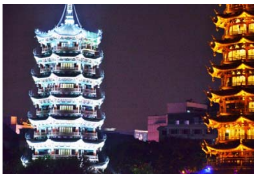
Ryc. 3 a, b Guilin. Ścisłe centrum historyczne. Zrekonstruowane Pagody Słońca i Księżycyca. Fig. 3 a, b Guilin. Historical city center. The reconstructed Pagodas of the Sun and Moon.

Słynące z produktów rolnych i rękodziela Guilin, po proklamowaniu komunistycznych Chin Ludowych, w 1949 roku zostało rozbudowane i przekształcone w duży ośrodek przemysłu maszynowego, chemicznego i papierniczego. Teraz, w wyniku wielkiej transformacji po śmierci Mao Tse Tung, ciężka produkcja przeniosła się na wschodnie wybrzeże, do wielkich metropolii blisko Pacyfiku, wraz z wielką emigracją siły roboczej. Dlatego współczesny Guilin jest ustawiany raczej na nowoczesną uprawę (m.in. ryżu, bambusa, trzciny cukrowej i cytrusów), połów ryb (także z wykorzystaniem łownych kormoranów), a przede wszystkim na turystykę. Rocznie odwiedza miasto od sześciu do dziewięciu milionów turystów. Na razie są nimi w ponad osiemdziesięciu procentach krajowcy, jednak znacznie narasta turystyka międzynarodowa. Dla jej obsługi, ciekawą konkurencją z zachodnimi kompaniami turystycznymi, podejmują przedsiębiorstwa miejscowe i rodziminy, mające swoistą przewagę poprzez kameralność i znanostwo prawdziwej swojskości, ukazywanej i ofiarowywanej wymagającym turystom.