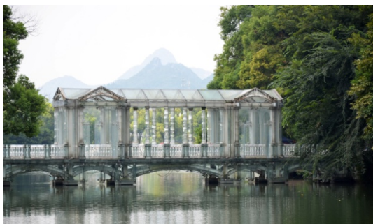
Ryc. 5 a Guilin. Skraj centrum nowoczesnego. Postmodernistyczny „Szklany (Kryształowy) Most Palladiański” wzorowany na moście w Parku Pałacowym Prior w Anglii

Ich struktura jest na połę prefabrykowana, a na połę tworzona ręcznie od zera przez fachowych rzemieślników, z pomocą ludności miejscowej. Transport elementów i surowców jest tradycyjny: za pomocą wozów z końmi albo wolami, lub małutkimi trójkołowymi samochodzikami dostawczymi. Wznoszone obiekty są kształtowane w tradycyjnym zarysie formy, ale z użyciem nowoczesnej technologii klejonego drewna, o wielkich panoramicznych oknach i z ciekawymi detalami na pograniczu tradycji oraz nowoczesności. Jest to eksperyment wiążący surowe państwowe planowanie, z lokalnym projektowaniem architektury. Cenne jest, przede wszystkim, eksperymentowanie nt. udziału ludności prywatnej, jako współdziałowców państwowej spółdzielczości produkcyjnej. Jest to kliniczny przykład z tzw. dalekiej prowincji, gdzie w aktywizującym się małym mieście i na wsi rozija się chiński eksperyment: wiązanie komunizmu z demokracją i gospodarką rynkową.