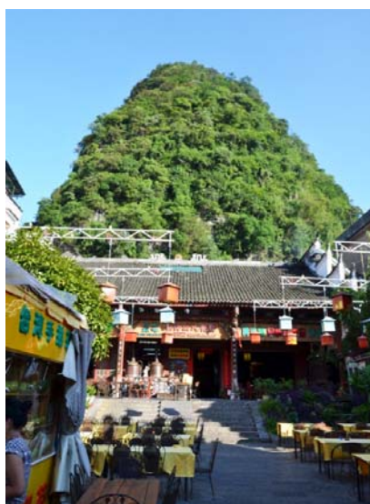
Ryc. 10 a Yangshuo. Ścisłe centrum, boczna wnęka Ulicy Zachodniej, zabytkowa herbaciarnia, w tle góra ściśle sąsiadująca z centrum.

Krótko sumując – chińska urbanistyka: geometryczna i organiczna, jest doniosłym i zbyt mało znanym, oraz niewystarczająco cenionym zjawiskiem w światowej kulturze. Dlatego zasługuje na uwagę. Wiele uczy odbiorcę, a we współczesnym badaczu – pobudza ważne i różnorodne refleksje.