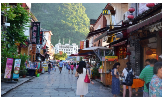
Ryc. 9 a Yangshuo. Ścisłe centrum, południowy kraniec 1400-letniej Ulicy Zachodniej, domy 1949 – 2015, w tle góry, ściśle otaczające centrum.

Fig. 8 b Yangshuo. Strict city center, a recess of Western Street and a newly built restaurant in the form of a pagoda with mountains visible in the background.