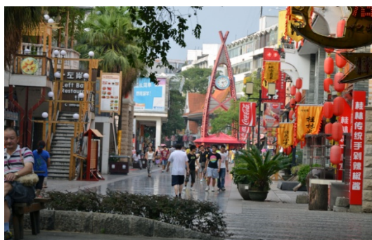
Ryc. 4 a Guilin. Ścisłe centrum nowoczesne. Odbudowana główna ulica, jako promenada.

japońskim (1937) i drugą wojną światową, a następnie komunizmem. Światły przywódca dr Sun Jat Sen kierował państwem i narodem w kierunku nowoczesności z otwarciem na świat, przy zachowaniu tradycji i odrębności [29]. Te 25 lat chińskich było odpowiednikiem dwudziestolecia międzywojennego Drugiej Rzeczypospolitej Polskiej. W analogiczny też sposób chińskie stare i wczesno modernistyczne centra, podobnie padły ofiarą wojen, jak stało się to w Europie. Centrum Guilin, odbudowywane było od 1949 r., po wojnie i rewolucji, przez komunistów Mao na wzór ZSRR: początkowo w stylu socrealistycznym a potem socmodernistycznym. W okresie transformacji nabiera podobnego blasku jak całe miasto (ryc. 4a). Prace nad gentryfikacją miast chińskich, są mieszanką sztywnych, arbitralnych, acz wysoce profesjonalnych planów, sporządzanych pod auspicjami Ministerstwa Planowania w Pekinie, w stylu iście bolszewickim; ale jednocześnie planowanie jest zasilane myślą Zachodnią, np. w postaci zamawianych, uznawanych i wdrażanych konsultacji Zachodnich doradców, takich jak Rem Koolhaas i inni [15].