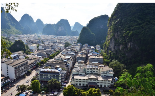
Ryc. 8 a Yangshuo. Ścisłe centrum widoczne w przeciwnym kierunku południowym, z lewej główna Ulica Zachodnia.

W bardzo wielu miejscach, bezpośrednio bliskie góry, stanowią „dopowiedzenie”, a zarazem zatrzymanie struktury urbanistycznej (ryc. 8b, 9a, 10a). Kreują one fascynujące zamknięcia perspektywiczne. Miasto z racji atrakcyjności estetycznej i biznesu turystycznego, ma znaczny procentowo udział mieszkańców - obcokrajowców, prowadzących sklepy, restauracje i biura turystyczne oraz pochodne przedsięwzięcia gospodarcze. Statystycznie występuje w Yangshuo wyjątkowo wiele napisów w innych językach niż chiński, a ilość małżeństw mieszanych jest - proporcjonalnie do liczby ludności - największa w całych Chinach [18].