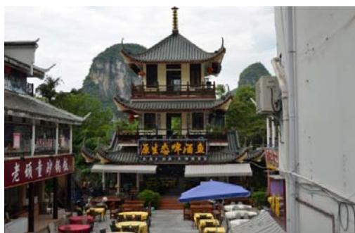
Ryc. 8 b Yangshuo. Ścisłe centrum, boczna wnęka Ulicy Zachodniej, nowa restauracja w formie pagody, w tle góry ściśle otaczające centrum.

Fig. 8 a Yangshuo. Strict city center visible in a view towards the south, to the left is Western Street.