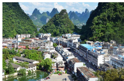
Ryc. 7 b Yangshuo. Ścisłe centrum, u dołu rynek, z prawej Ulica Zachodnia.

Fig. 7 a Yangshuo. Strict city center with the market below, to the right is the main Western Street, delineated around the year 600 CE.