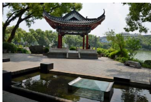
Ryc. 4 b Guilin. Skraj centrum nowoczesnego. Nowy park miejski. Rejon międzypokoleniowy.

Fig. 4a Guilin. Historical city center. The reconstructed main street as a promenade.