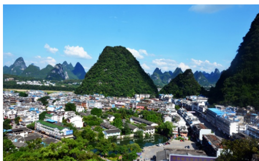
Ryc. 7 a Yangshuo. Ścisłe centrum, u dołu rynek, z prawej główna Ulica Zachodnia wytyczona około roku 600 n.e.

Fig. 6 b Yangshuo. View in the direction of the Li river and the city's location on a mountain coastal plateau.