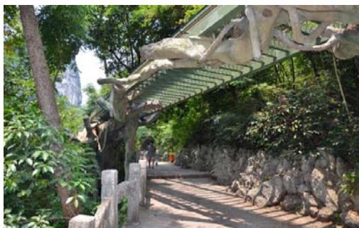
Ryc. 5 b Guilin. Trasa kolejki (pod)miejskiej do Groty Trzciniowego Fletu. Stalowa konstrukcja estakady przeplata się z konarami platanu.

Fig 5 a Guilin. Edge of the modern city center. The postmodernist "Glass (Crystal) Paddian Bridge", inspired by the bridge in the Palace Park in Prior, England.