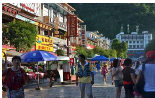
Ryc. 9 b Yangshuo. Motyw jak na ilustracji poprzedniej, zbliżenie. Sfera usług, handlu i zamieszkiwania o idealnej ludzkiej skali, sprzyjająca niewymuszonym, przyjaznym relacjom społecznościowym.

Fig. 9 a Yangshuo. Strict city center. The southern end of Western Street, with the mountains that tightly surround the center visible in the background.