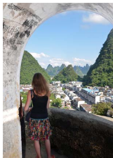
Ryc. 10 b Yangshuo. Widok z pagody na szczycie góry, w kierunku głównej Ulicy Zachodniej.

Fig. 10 a Yangshuo. Strict city center, side recess of Western Street. Historical tea house and mountains in the background.