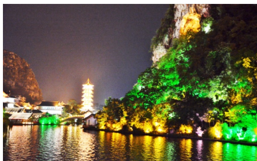
Ryc. 2a Guilin. Skraj miasta lokacyjnego. Naturalna kompozycja elementów przyrodniczych i budowlanych.

Znaczenie Guilin ma swój początek w dalekowzroczonej polityce pierwszego cesarza dynastii Qin panującego w latach 221-206 p.n.e. Kolejnym czynnikiem miastotwórczym, tym razem wywodzącym się z natury ujętej w ryzy cywilizacyjne i kulturowe, stał się średniowieczny Kanał Ling. Umożliwił on mniejszym statkom przepłynięcie z rzeki Jangcy na północy - do Rzeki Perłowej na południu. Dzięki tej innowacji transportowej w makroskali, Guilin szybko stał się ważnym węzłem handlowym na trasie z Chin Środkowych do Kantonu nad Morzem Południowochińskim [37] (Por. handlowe miasta nadrzeczne w Europie, w tym nadwiślańskie.) Obecnie jest ważnym w skali regionu, miastem powiatowym.