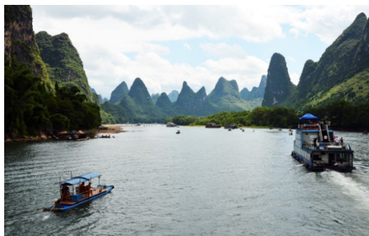
Ryc. 6 a Yangshuo. Brama Północna - rzeka Li dopływająca do miasta.

Popularne staje się też kolarstwo turystyczne i górskie oraz turystyka krajoznawcza. Rekordowym okazem w tej dziedzinie jest zbadane, jako liczące ponad tysiąc trzysta lat zdrowe drzewo figowe, rosnące u progów miasta. Yangshuo zostało trafnie zlokalizowane na wypłaszczonej „patelni” terenowej, wytworzonej na zakręcie rzeki Li, przy ujściu do niej lokalnej rzeki Yulong. Jest to umiejscowienie w fenomenalnej scenerii „bramy” skalnej (ilustr. 6a), jak gdyby w talerzowej wnęce – kotlinie, otoczonej górami, z wyjątkiem odcinka wybrzeża rzecznej (ryc. 6 b). Nabrzeżne płaskie i horyzontalne tarasy oferują spokój, kojący emocje wywoływane przez strzeliste, dramatycznie wertykalne góry [16].