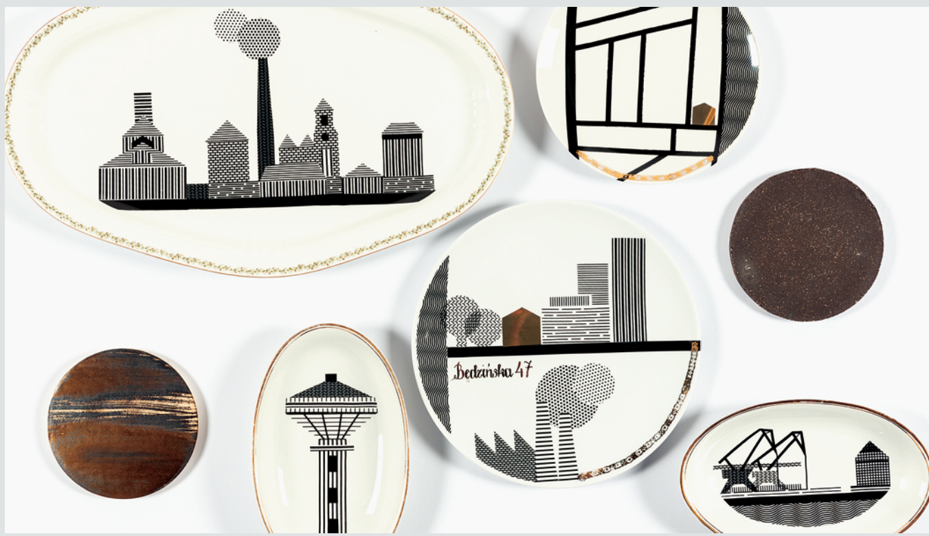
Fot. 4. Talerze ceramiczne Kliwie na Szklivie