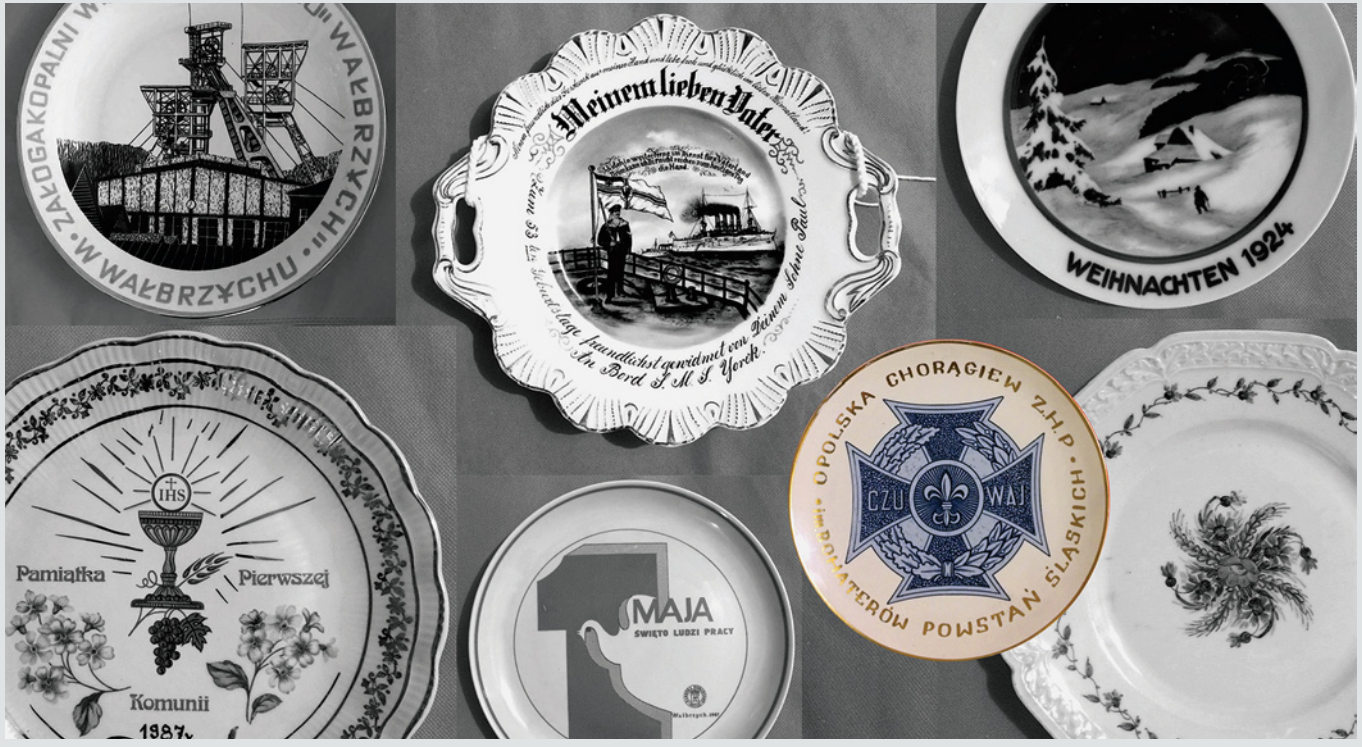
Fot. 1. Dokumentacja archiwów