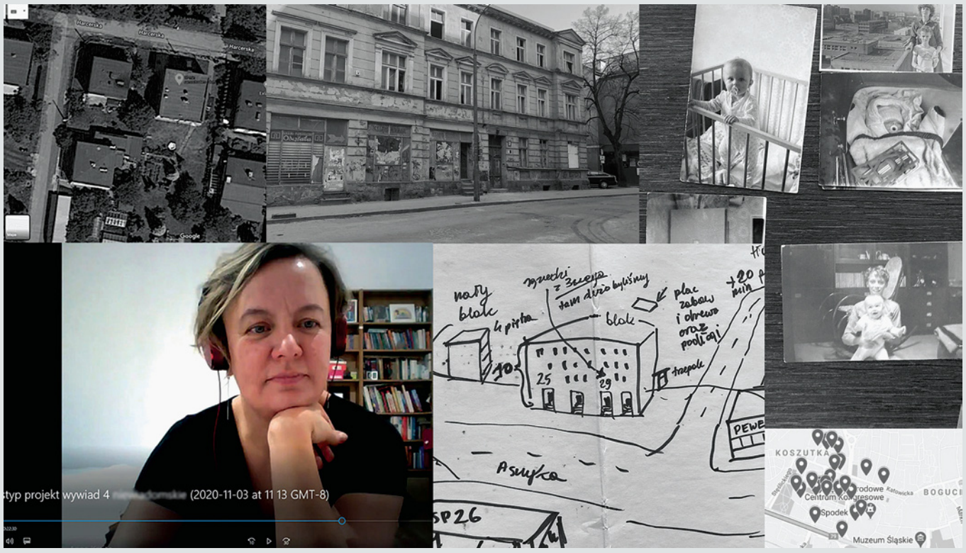
Fot. 2. Wywiady z użytkownikami