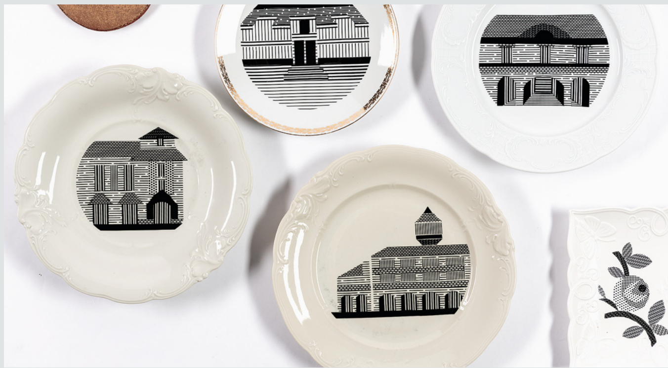
Fot. 5. Talerze ceramiczne Ckliwie na Szklivie

Jako że głównym zamysłem autorki jest ocalenie od zapomnienia już istniejących wytworów kultury materialnej, za materiał wyjściowy posłużyły wyprodukowane w ciągu ostatnich