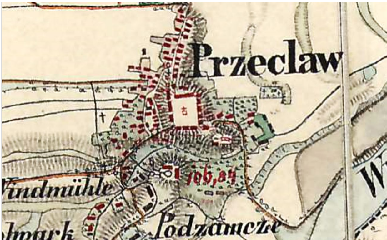
Ryc. 6. Przecław na Drugim Zdjęciu Wojskowym – Mapie Galicji i Bukowiny z lat 1861–1864; www.mapire.eu (dostęp: 28 IV 2020). Fig. 6. Przecław on the Second Military Survey—a Map of Galicia and Bukovina from the years 1861–1864; www.mapire.eu (accessed: 28 IV 2020).