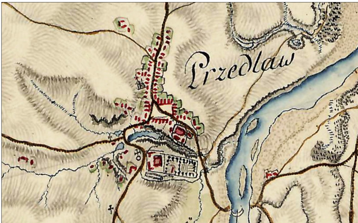
Ryc. 4. Przecław na Pierwszym Zdjęciu Wojskowym – Mapie Galicji i Lodomerii z lat 1779–1783; www.mapire.eu (dostęp: 28 IV 2020).