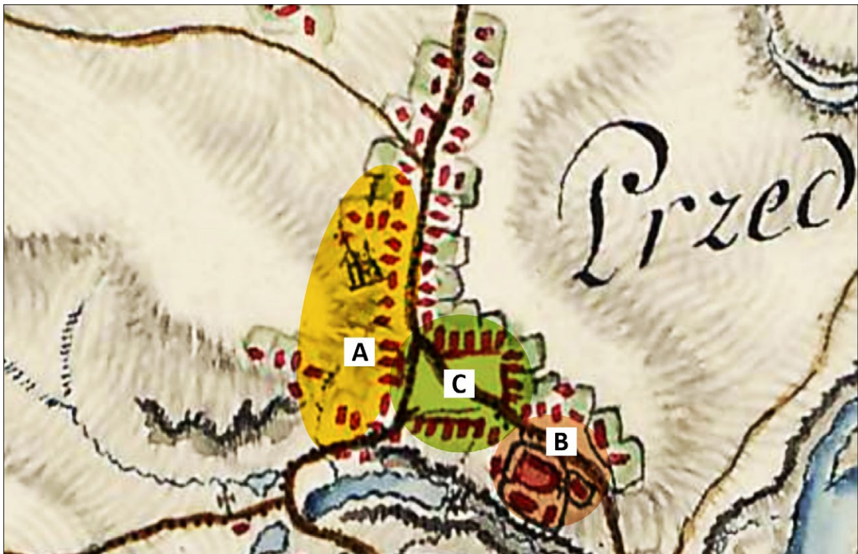
Ryc. 2. Obszar osady targowej (A), drugiej osady lub kontynuacji osadnictwa związanej z osadą targową (B) oraz miasta lokacyjnego (C) w Przecławiu, zaznaczone na Pierwszym Zdjęciu Wojskowym – Mapie Galicji i Lodomerii z lat 1779–1783; www.mapire.eu (dostęp: 28 IV 2020).