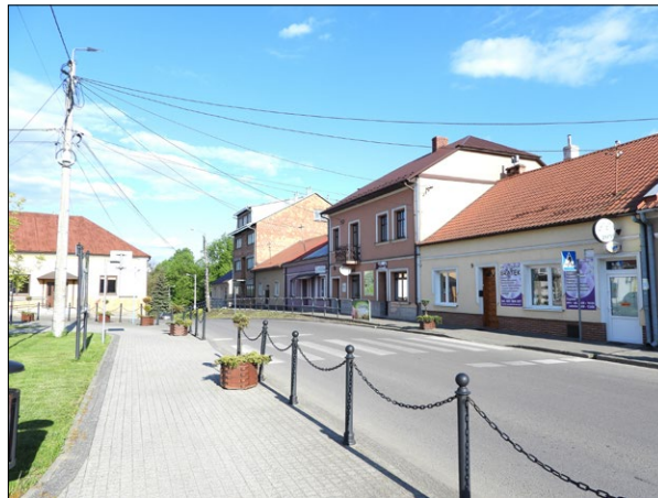
Ryc. 8. Widok na rynek w Przeclawiu (fragment pierzei południowej) od strony zachodniej, rok 2020; fot. autorzy.

Fig. 7. Present-day view of the market square in Przeclaw from the southwest, 2020; photo by the authors.