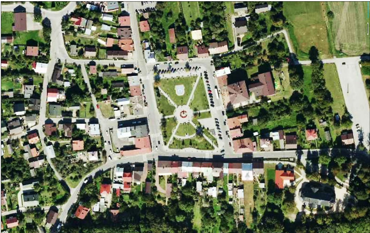
Ryc. 1. Współczesny Przecław na ortofotomapie ukazującej historyczne centrum miasta; https://mapy.geoportal.gov.pl (dostęp: 24 IV 2020). Fig. 1. Present-day Przecław on an orthophotomap depicting the historic center of the town; https://mapy.geoportal.gov.pl (accessed: 24 IV 2020).

historii rozwoju ośrodków miejskich. Warto przy tym zauważyć, że ustawiczne pogłębianie oraz porządkowanie wiedzy dotyczącej rozwoju przestrzennego zabytkowych polskich miast jest obecnie, w drodze ich rozwoju i przemian, niezmiernie istotne, gdyż może zapobiec utraceniu przez te ośrodki cennych wartości kulturowych.