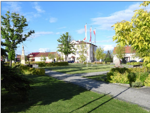
Ryc. 7. Widok na rynek w Przeclawiu od strony południowo-zachodniej, rok 2020

Fig. 7. Present-day view of the market square in Przeclaw from the southwest, 2020