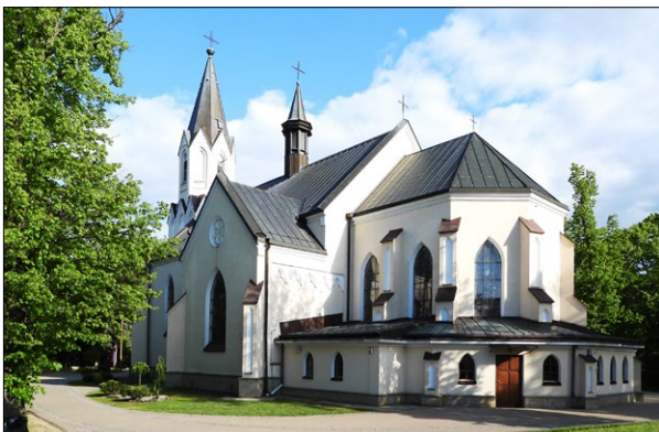
Ryc. 9. Widok na kościół parafialny pw. Wniebowzięcia NMP w Przeclawiu, rok 2020; fot. autorzy.

Fig. 8. Present-day view of the market square in Przeclaw (fragment of the southern frontage), from the west, 2020; photo by the authors.