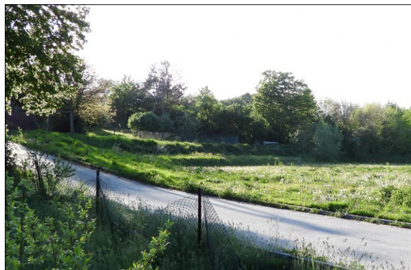
Ryc. 10. Widok od strony wschodniej na relikty dawnych obwarowań miasta w postaci wałów, rok 2020; fot. autorzy.

Fig. 9. View of the parish Church of the Assumption of Virgin Mary in Przeclaw, as seen today, 2020; photo by the authors.