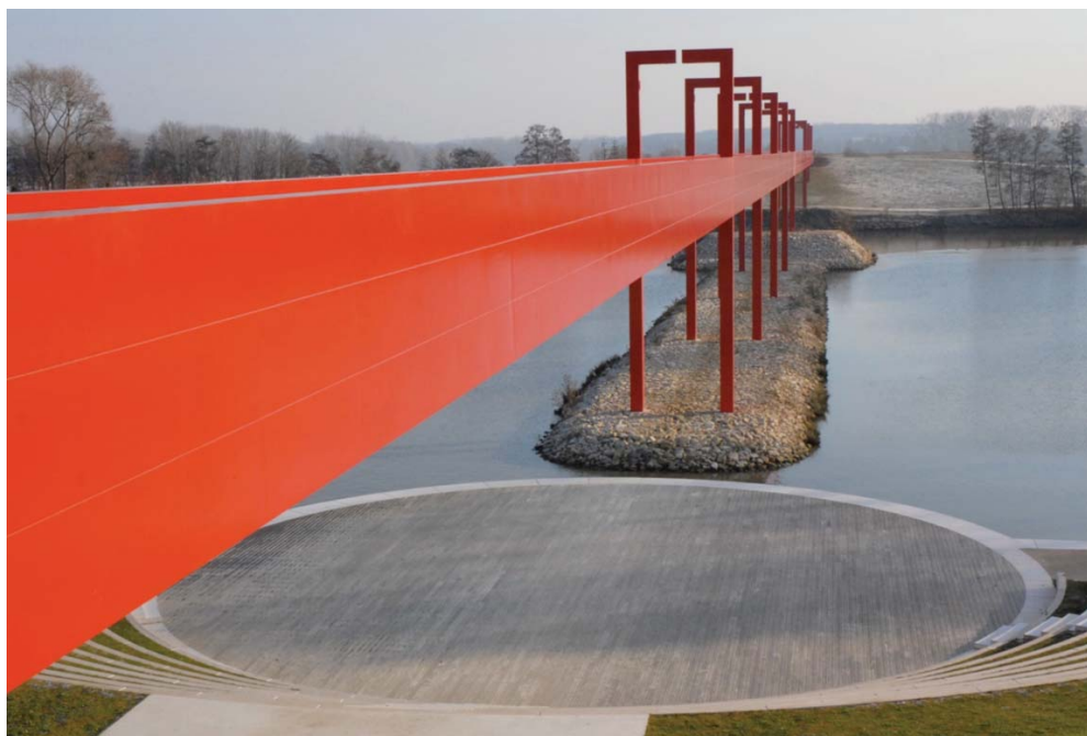
Il. 3. Dani Karavan, Axe Majeur.