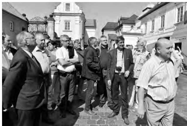
Rys. 5. Prezesi oddziałów, w czasie 13 Rady Prezesów SEP zwiedzają Sanktuarium Jasnogórskie (20 maja 2017 r.)