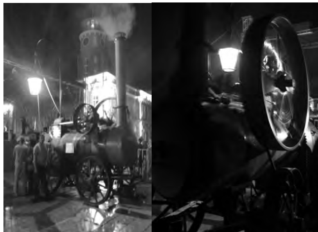
Rys. 4. Dymiąca lokomobila i paląca się w strugach deszczu lampa łukowa na placu im. Wł. Biegańskiego w Częstochowie (w tle budynek dawnego ratusza obecnie Muzeum Częstochowskie); kręcące się koło zamachowe lokomobili napędzające dynamomaszynę, zasilającą energią elektryczną lampę łukową