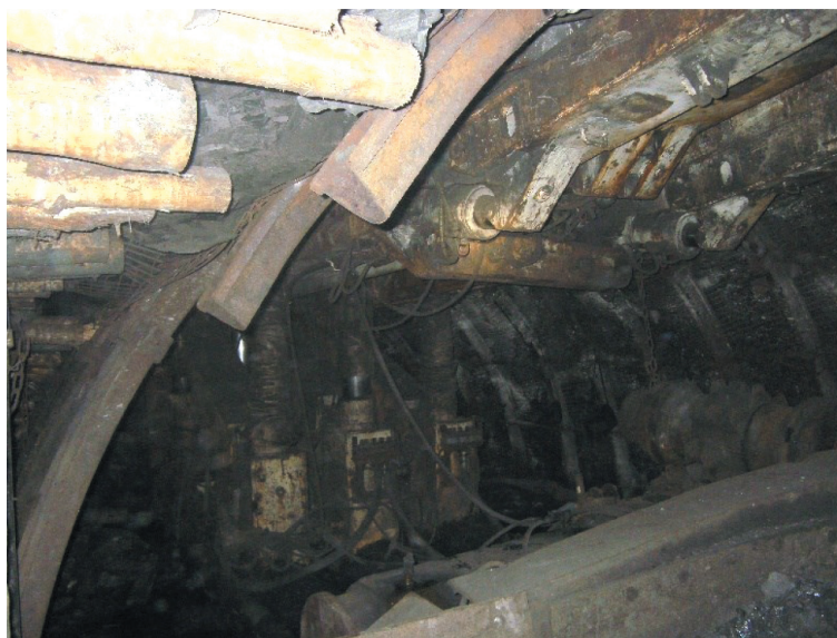
Rys. 1. Odrzwia obudowy łukowej typu ŁP z wypiętym łukiem ociosowym

Sekcje specjalne do skrzyżowania ściana-chodnik są stosowane w zróżnicowanych warunkach geologiczno-górnictwowych, wymagają właściwego postępu ściany, dużej umiejętności załogi w zakresie obsługi, nie potrzebują wzmocnienia obudowy przed ścianą, przy czym nie umacniają chodnika przed skrzyżowaniem [3]. Sterowanie obudową chodnikową odbywa się za pośrednictwem rozdzielaczy hydraulicznych umiejscowionych w sekcji w taki sposób, aby operator zawsze znajdował się pod nieruchomym segmentem sekcji lub poza obrębem sekcji w bezpiecznej odległości.