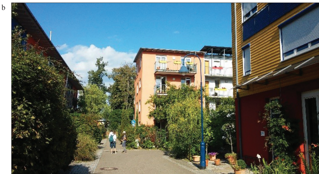
3. Freiburg, osiedle solarne Vauban z dachami solarnymi oraz przestrzenie półpubliczne wewnątrz osiedla. Fot. J. Kleszcz, 2015 r.