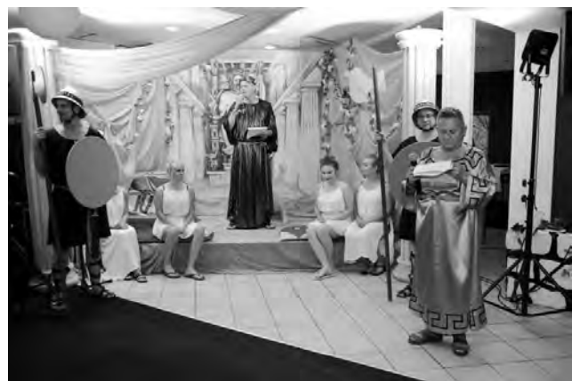
Rys. 3. Kabaret „Rak” na scenie XXIX „Sympozjum u Zeusa” w 2017 roku