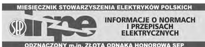
Rys. 4. Winieta miesięcznika INPE

W roku 1995 założył i został naczelnym redaktorem Miesięcznika SEP „INPE. INFORMACJE O NORMACH I PRZEPISACH ELEKTRYCZNYCH”. Kierował Zakładem Wydawniczym „INPE” COSiW SEP w Bełchatowie. Był pomysłodawcą tego popularnego i poczytnego czasopisma, które z założenia miało być pomocne członkom SEP zajmującym się projektowaniem, wykonawstwem oraz eksploatacją sieci, instalacji i urządzeń elektrycznych, dzięki informacjom o aktualnych przepisach, normach i zasadach wiedzy technicznej w zakresie szeroko rozumianej elektryki. W swoich artykułach omawiał trudne zagadnienia, jak np. problemy energetyki wiejskiej [4].