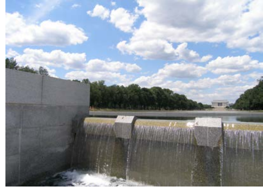
Ryc. 1. Waszyngton, National Mall, a/ National World War II Memorial i Washington Monument, b/ Lincoln Memorial.