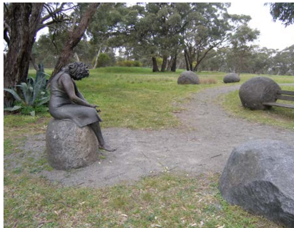
Fot. 5. Colebrook Memorial, Eden Hills, Adelaide, a. fontanna łez; b. opłakująca matka.