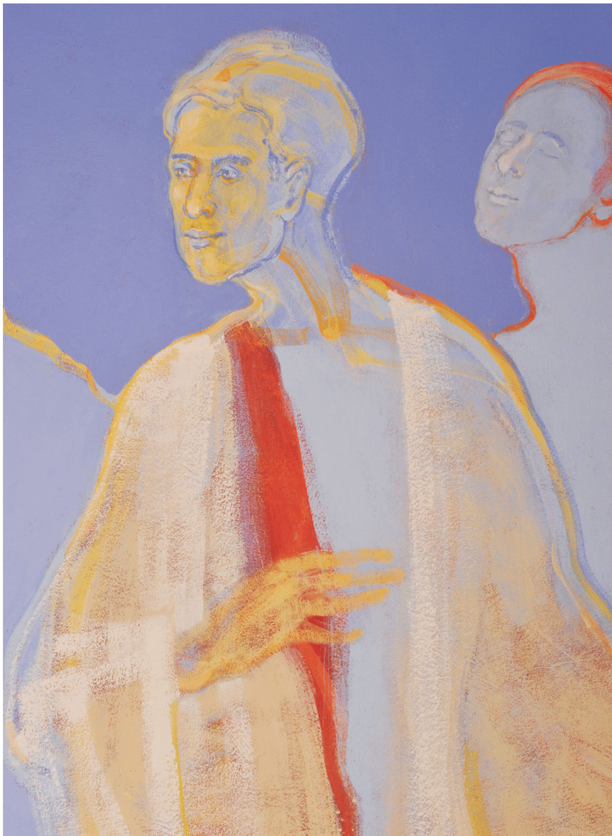
Ryc. 5. Pier Giorgio Frassati, fragment autorskiej polichromii w kaplicy Bożego Ciała w Szczecinie; fot. A. Biegowski, H. Król Fig. 5. Andre Frosatti, fragments of the polychromy by the author in The Corpus Christi Chapel in Szczecin; photo by A. Biegowski, H. Król