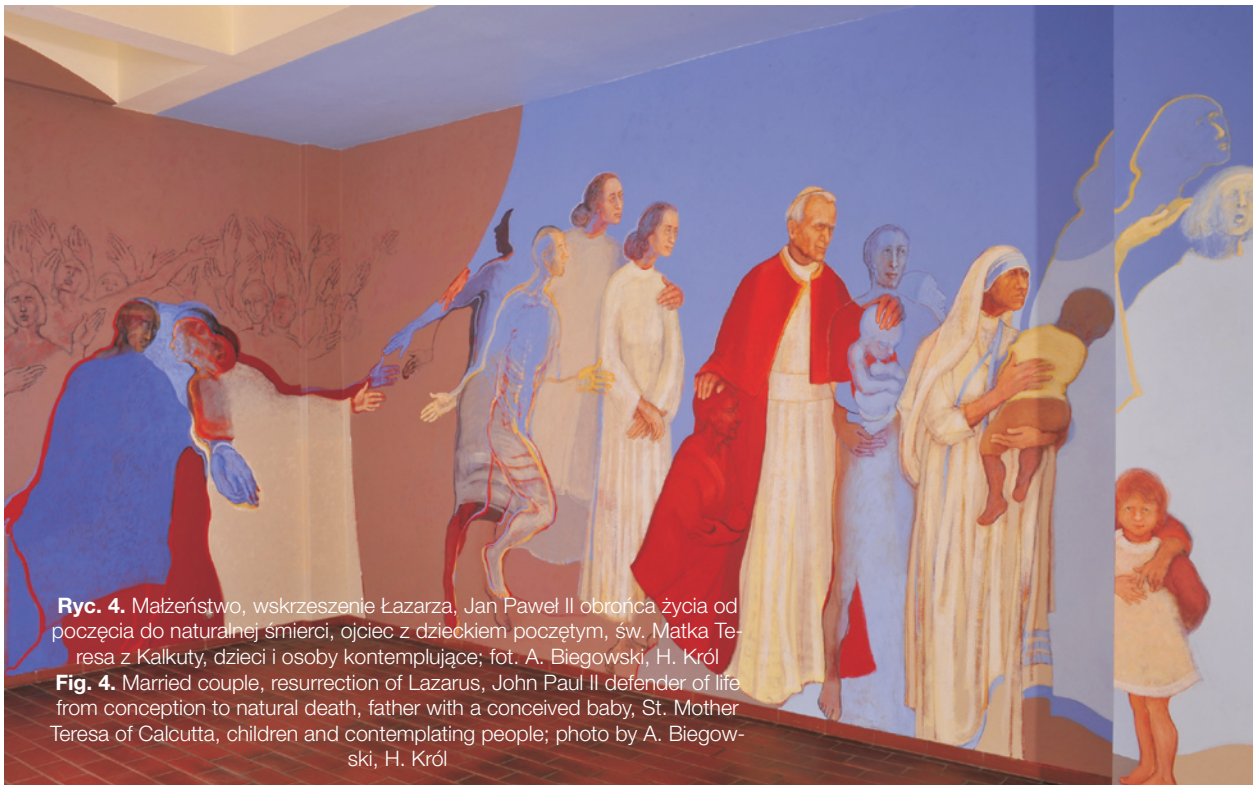
Ryc. 4. Małżeństwo, wskrzeszenie Łazarza, Jan Paweł II obrońca życia od poczęcia do naturalnej śmierci, ojciec z dzieckiem poczętym, św. Matka Teresa z Kalkuty, dzieci i osoby kontemplujące