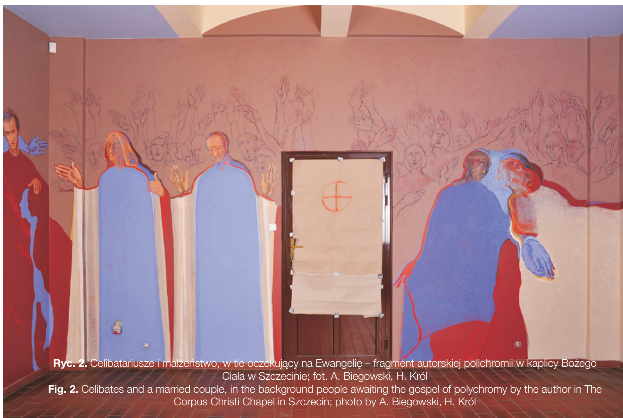
Ryc. 2. Celbatariusze i małżeństwo, w tle oczekujący na Ewangelię – fragment autorskiej polichromii w kaplicy Bożego Ciała w Szczecinie; fot. A. Biegowski, H. Król