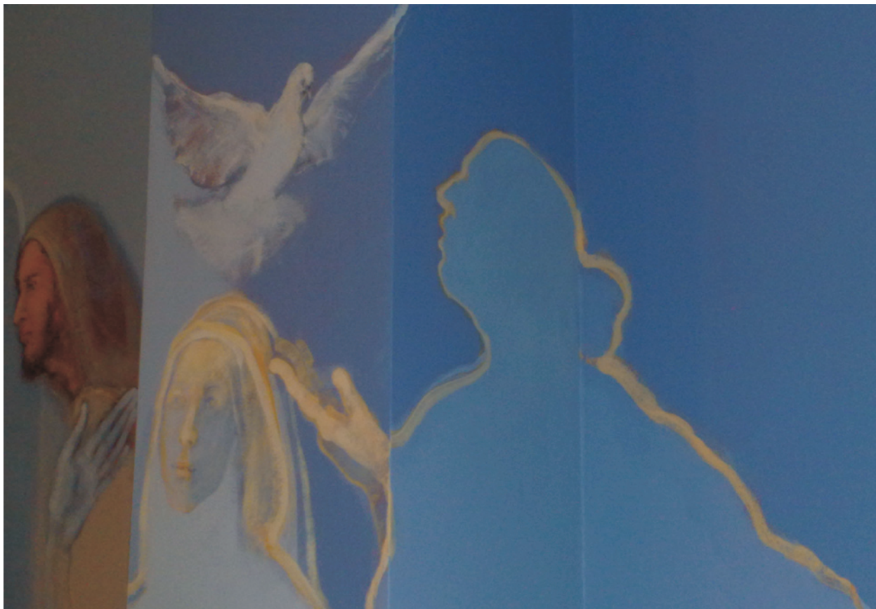
Ryc. 6. Św. Józef, św. Teresa – fragment autorskiej polichromii w kaplicy Bożego Ciała w Szczecinie; fot. A. Biegowski, H. Król Fig. 6. St. Josef, St. Teresa, fragments of the polychromy by the author in The Corpus Christi Chapel in Szczecin; photo by A. Biegowski, H. Król