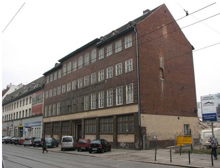
Rys. 8. Widok budynku kasy oszczędnościowej i spółdzielni Vortwärts.