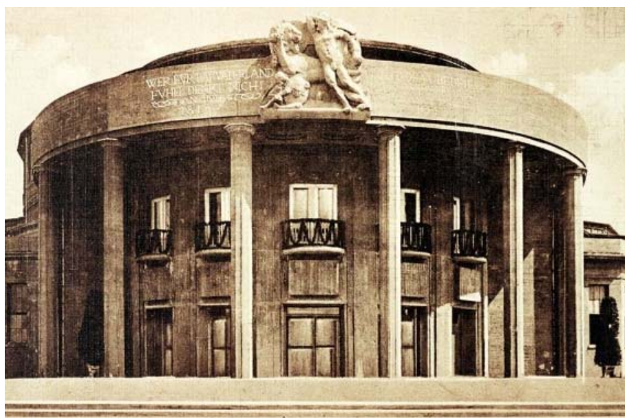
Rys. 4. Główne wejście do Hali Stulecia z widoczną płaskorzeźbą autorstwa Alfreda Vöcke [7].

rytach budowla miała prostą, czystą formę podkreślona surowością betonu. Tak ekstrawagancki budynek stał się symbolem awangardowego Wrocławia. Nad głównym wejściem widniała płaskorzeźba przedstawiająca mężczyznę walczącego z lwem, symbolizująca zwycięstwo nad Napoleonem, którą Vöcke wykonał nawiązując do setnej rocznicy odezwy króla Prus Fryderyka Wilhelma III wzywającej do walki z wojskami Napoleona (rys. 4). Płaskorzeźba nie zachowała się, natomiast Hala Stulecia niezmiennie znajduje się wśród najbardziej znamienitych budynków wrocławskiego modernizmu, rozpoznawalnym nie tylko w regionie ale również na świecie, co potwierdza wpisanie obiektu na Listę Światowego Dziedzictwa UNESCO w 2006 roku [3].