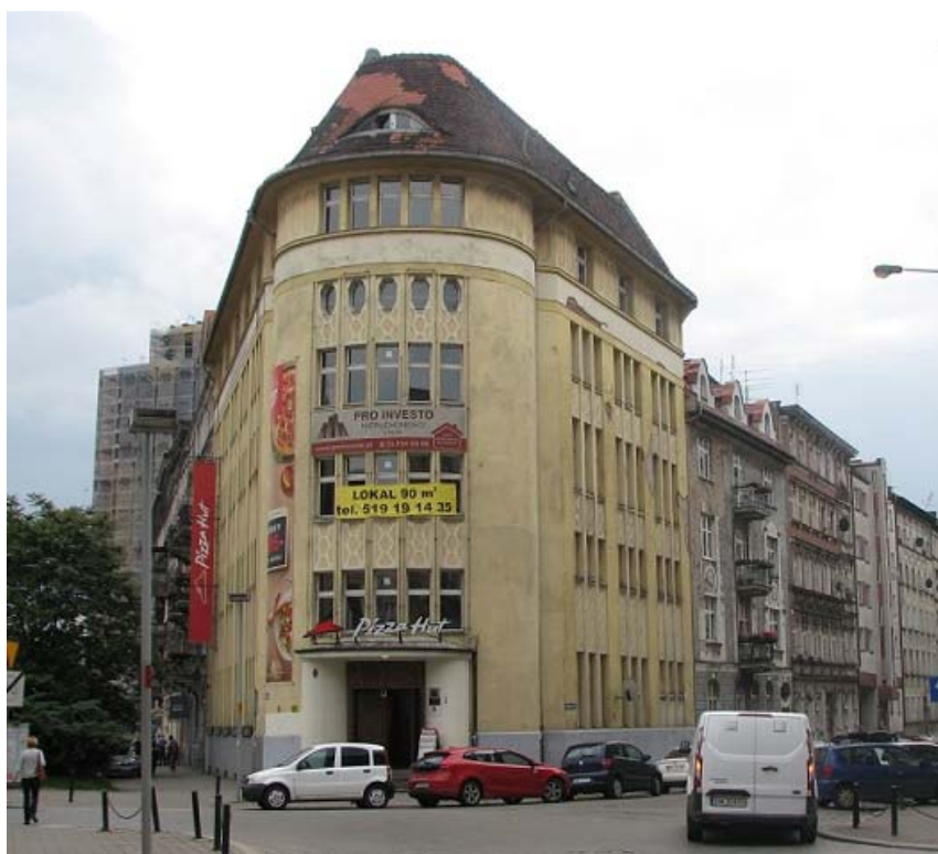
Rys. 2. Budynek przy ul. Marii Skłodowskiej-Curie 1 widziany od frontu.

prefabrykowane, w czym można odnaleźć propagowany już wtedy funkcjonalizm. Czytelne podziały zostały wprowadzone w elewacji poprzez rytmiczny układ okien podkreślony pionowymi lizenami oraz zgeometryzowaną dekoracją sieciową wykonaną w tynku.