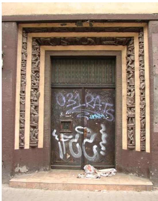
Rys. 9. Portal wejściowy przy ul. Kościuszki 133.

Wśród przedstawionych postaci umieścił między innymi: murarza, kataryniarza, piekarza, kobietę idącą z zakupami, matkę czeszącą córkę, kowala, stolarza, rodzinę, mężczyznę ścinającego włosy czy kobietę dojącą krowę (rys. 10). Płaskorzeźby, w stylu nawiązującym do Art Déco, wykonał w ceramice, a na niektórych z nich umieścił napisy, między innymi swoje nazwisko oraz „Berlin” miasto, w którym prawdopodobnie wykonane