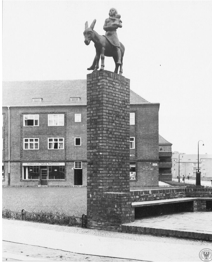
Rys. 7. Archiwalne zdjęcie Madonny na osiołku [10].

wadzenia detalu architektonicznego jest portal autorstwa Alfreda Vöcke. Rzeźbiarz w podwójnej ramie umieścił płaskorzeźby przedstawiające 35 scen z życia ówczesnego społeczeństwa (rys. 9). Można dopatrzeć się swoistego opowiadania o dniu codziennym wrocławian w świecie współczesnym autorowi.