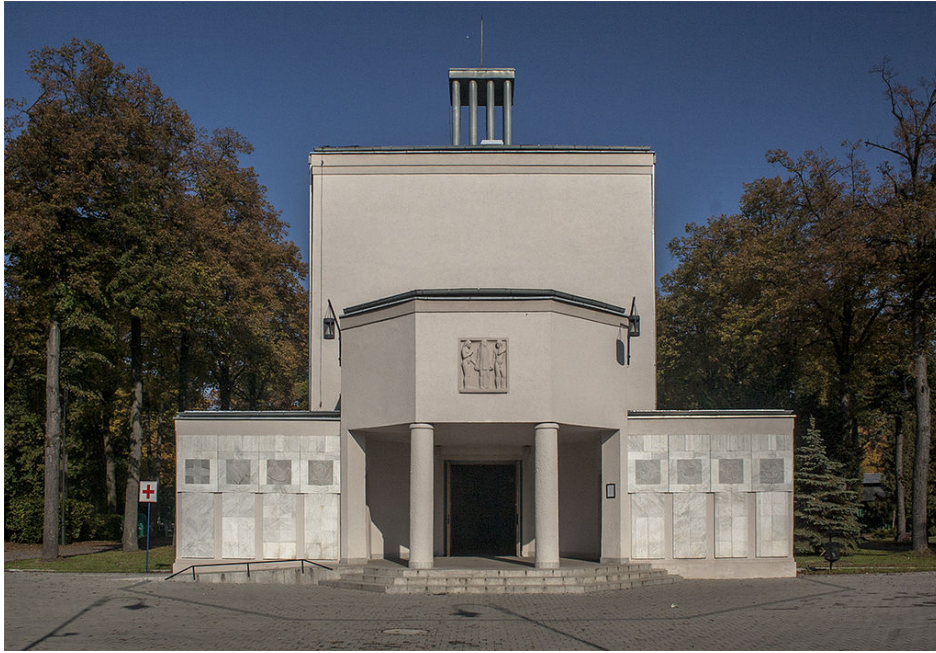
Rys. 5. Kaplica cmentarna na cmentarzu w dzielnicy Osobowice [8].