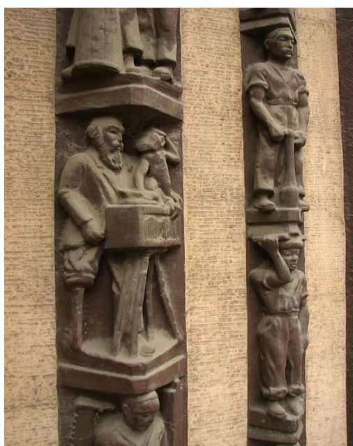
Rys. 10. Płaskorzeźba wykonana przez Alfreda Vöcke.

zostały płaskorzeźby. Sam portal podobnie jak cały budynek znajduje się w złym stanie technicznym. Niektóre z płaskorzeźb zostały uszkodzone, a wszystkie przemalowane na brązowy kolor. Trudno zatem dopatrzeć się pierwotnej kolorystyki. Zachowany portal jest jednym z przykładów braku odpowiedniej troski o zachowane dziedzictwo.