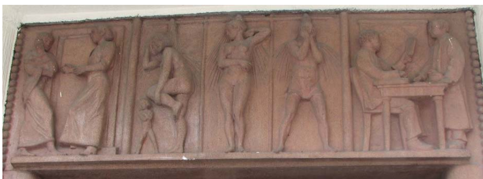
Rys. 3. Płaskorzeźby umieszczone nad wejściem do budynku przy ul. Marii Skłodowskiej-Curie 1.

od prawej strony mężczyznę, kobietę oraz kobietę z dzieckiem. W prawej części ryzalitu widzimy poborcę podatkowego podczas pobierania opłat, z lewej zaś strony matkę z dzieckiem na ręku oraz towarzyszącą im kobietę (rys. 3).