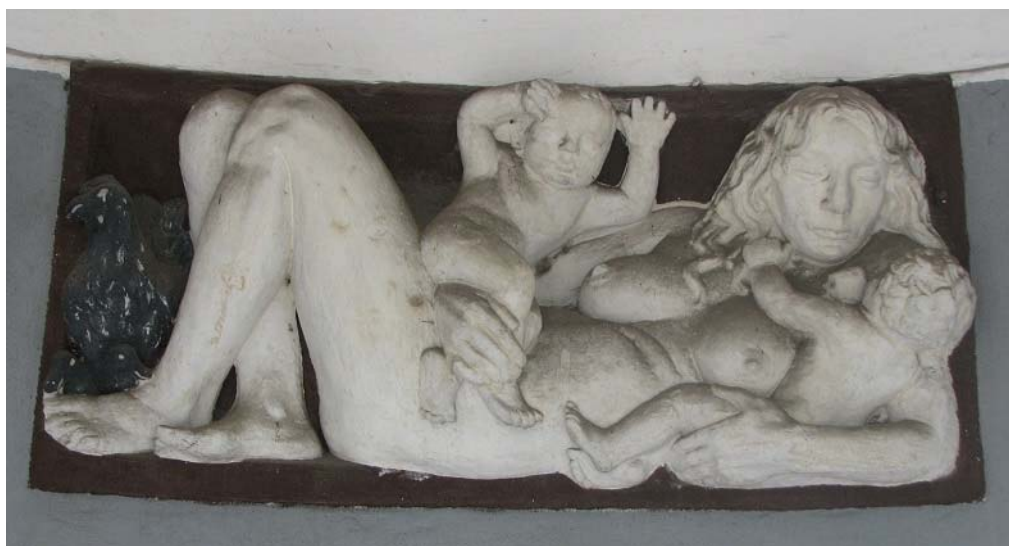
Rys. 1. Płaskorzeźba nad wejściem do szpitala ochronki dla niemowląt.