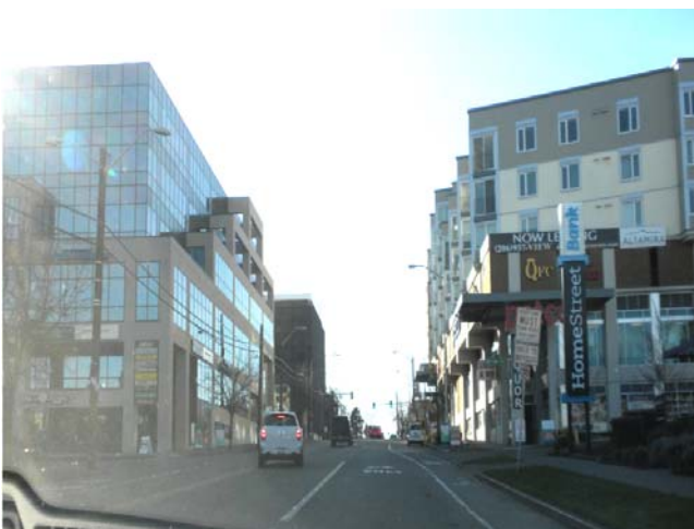
Ryc.2. Nowa zabudowa w West Seattle Junction – hub urban village. Źródło: Fot. Paweł Godzina

Fig. 1. Urban centers/villages in Seattle. Source: [11]