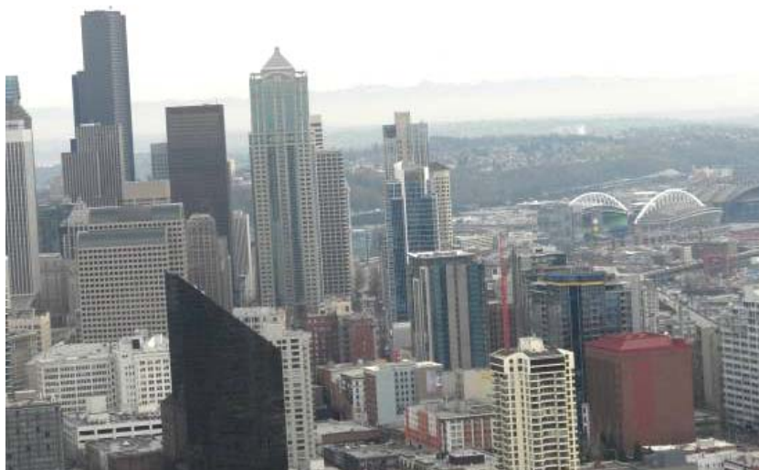
Ryc. 5. Widok ze Space Needle na centrum Seattle i górę Rainier, Źródło: Fot. Paweł Godzina Fig. 5 .View from Space Needle over Seattle downtown and Mount Rainier. Source: Paweł Godzina

W zakresie przestrzeni publicznych (ang. public space ) podkreślono przede wszystkim rolę powiązań między obszarami koncentracji ludności z systemem terenów zieleni, a także ukształtowanie spójnego systemu zieleni. W związku z różnorodnością etniczną miasta zwrócono uwagę na kulturowe uwarunkowania przy projektowaniu przestrzeni publicznych [10].