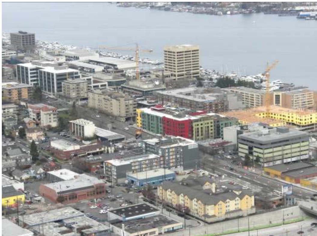
Ryc. 3. South Lake Union – urban center. Plac budowy. Fig. 3. South lake Union – construction area.

W Seattle wyróżniono 41 jednostek urbanistycznych – urban centers i urban villages . W tabeli 1 przedstawiono liczbę ludności jednostek strukturalnych oraz zmiany ludności w okresie 20 lat (1990–2010). Można zauważyć, że jednostki o największej liczbie ludności mają jednocześnie największy przyrost mieszkańców – Belltown (północna część Downtown), University District, Uptown, Ballard, South Lake Union i MLK at Holy Street. Belltown, Uptown i South Lake Union znajdują się w centrum Seattle, natomiast University District i Ballard po północnej stronie Union Canal. MLK at Holy Street to dzielnica o zróżnicowanej strukturze etnicznej z dużą ilością ludności azjatyckiego pochodzenia [13]. Z powyższej tabeli można zauważyć, że około 65% wzrostu ludności miało miejsce w wyznaczonych jednostkach strukturalnych – urban villages . W Seattle w ciągu 20 lat ludność wzrosła o ponad 90 tys. [1]. Wdrażana strategia rozwoju „wiosek miejskich” jest reakcją na wzrost ludności na obszarze metropolitalnym Seattle. W przestrzeni miasta można zaobserwować proces budowy nowych obiektów, takich jak nowa zabudowa w South Lake Union (ryc. 3) czy nowa zabudowa przy Alaska Street w West Seattle Junction (ryc. 2).