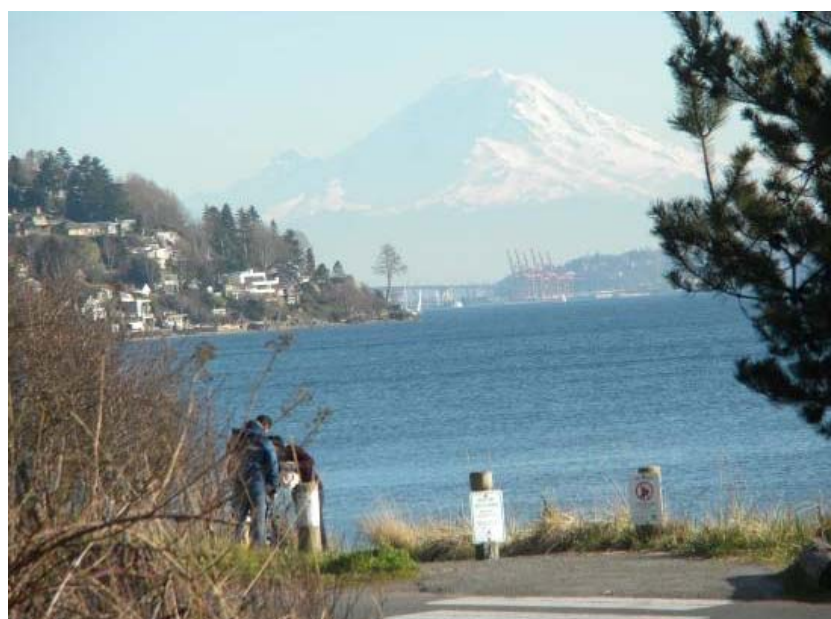
Fig. 6 .Mount Rainier – view from Discovery Park.