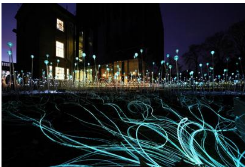
Fig.10. Light sculptures on the Durham Light Festival.