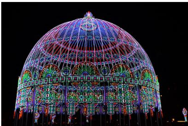
Fot.6. Festiwal Światła w Ghent (Belgia).