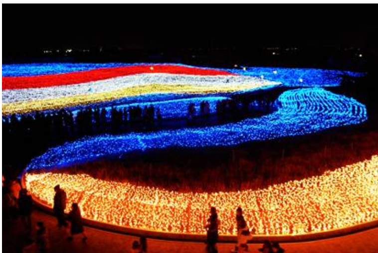
Fot. 3. Zimowy Festiwal Światła w Kuwanie w Japonii Fête

również formy oświetleniowe czerpią określone korzyści. Sponsorzy, przekazując na rzecz miasta środki finansowe, oczekują w zamian możliwości wykorzystania i reklamy swoich produktów w przedsięwzięciu. Do zobrazowania tego zjawiska może posłużyć przykład z Łodzi, gdzie jednym z inicjatorów festiwalu światła o nazwie „Light Move Festival” była jedna z czołowych firm oświetleniowych na polskim rynku. Oprócz prezentacji swoich najnowszych produktów, celem sponsora było uświadomienie mieszkańcom Łodzi możliwości wykorzystania najnowszych technologii oświetleniowych do wizualnej poprawy wyglądu miasta. Podczas trzech dni trwania łódzkiego festiwalu zostało podświetlonych trzydzieści kamienic. Koszty zużycia energii elektrycznej w tym czasie wzrosły o ok. 100 zł. Co oznacza że dzienny koszt iluminacji jednej kamienicy wynosi poniżej dwóch złotych. Całoroczna iluminacja trzydziestu kamienic w centrum miasta kosztowałaby Łodzian ok. 12 tys. złotych.