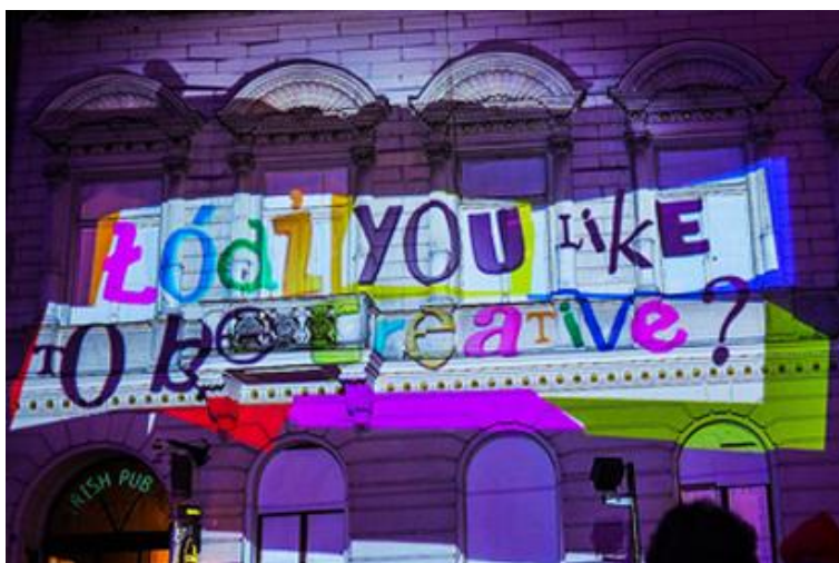
Fig.2. Festival of Lights in Łódź- Light Move Festival

Zyski generowane przez ruch turystyczny podczas imprez są włączane bezpośrednio do lokalnego obiegu gospodarczego. Pierwszą grupę beneficjentów stanowią osoby i podmioty gospodarcze sprzedające swoje usługi turystom tj. właściciele obiektów noclegowych, gastronomicznych, środków transportu, urządzeń rekreacyjnych, rozrywkowych, handlowych. Drugą grupą czerpiącą korzyści z festiwalu to artyści, bowiem jednym z głównych założeń festiwalu jest wspieranie i promowanie artystów lokalnych. Bezpłatne koncerty, przedstawienia czy wernisaże są dostępne dla każdego, dzięki czemu młodzi artyści mają szansę na promocję. Warto również wspomnieć, że duży udział w organizacji tego typu wydarzeń w mieście mają sponsorzy- głównie firmy oświetleniowe. Sponsoring, bowiem, jest jednym z najbardziej wyrafinowanych narzędzi wspierających wizerunek miasta. Sponsoring jest relacją partnerską, w wyniku, której obie strony- miasto jak