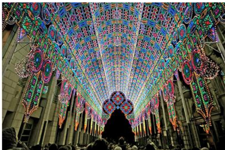
Fot.5. Festiwal Światła w Ghent ( Belgia)

Powyższe stwierdzenie wydaje się dość banalne, ale może przekonujące dla władz miejskich i mieszkańców. Warto zauważyć, że w ostatnich latach rozwój miast w Polsce, podporządkowany jest głównie celom inwestycyjnym. Kształtowanie przestrzeni i krajobrazu ma głównie charakter regulacyjny a nie motywacyjny. Dlatego też organizacja imprez takich jak wspomniane festiwale światła, może przyczynić się do planowania nowych inwestycji, korzystnych nie tylko dla jednostki, ale również dla miasta.