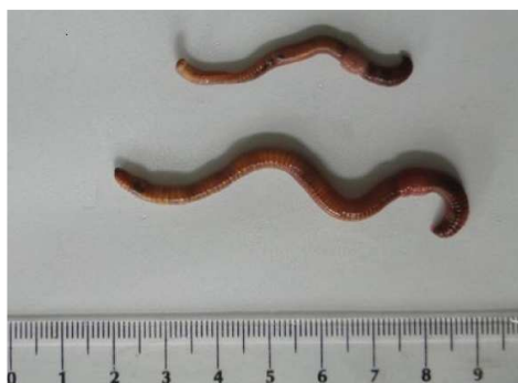
Rys. 3a. Dojrzałe osobniki E. fetida (na górze zdjęcia) i D. veneta

Dane w tabeli 2 wskazują, że liczebność dżdżownic obu gatunków w pojemnikach z wermikulturą wzrastała, przy czym średni przyrost liczebności E. fetida po 3 miesiącach był ponad 4-krotnie wyższy (o 1917±315 osobników) niż D. veneta (o 387±45 osobników) ( p = 0,001 ). Z racji znacznej różnicy wielkości obu gatunków ( p = 0,001 ) (rys. 3a i b) oraz wolniejszego przyrostu masy D. veneta ich średnie sumy biomasy w tym czasie zrównywały się ( p = 0,07 ), choć populacje reprezentowały różne tempo jej przyrostu ( p = 0,02 ) (przyrost o 65,88±7,0 g dla E. fetida i 30,9±13,8 g dla D. veneta ) (tab. 2).