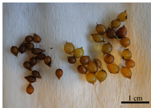
Rys. 3b. Kokony E. fetida (po lewej stronie) i D. veneta