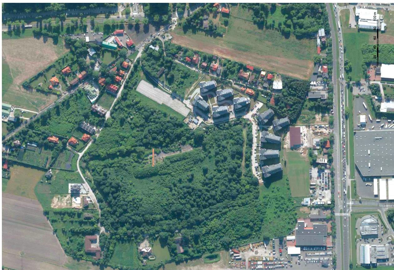
Il. 1. Fort IV Chrzanów w Warszawie, widok z góry – zielen przesłania formę fortu