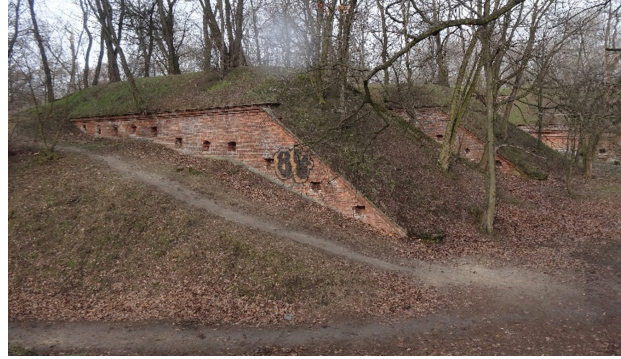
Il. 6. Fort Cze (Piłsudskiego) w Warszawie. Poprzecznice (fot. C. Głuszek, 2006)

Obecnie klinicznym wręcz przykładem niezrozumienia inwestorsko-projektowego są uzupełnienia nową zabudową przeprowadzane bez niezbędnych badań i wytycznych konserwatorskich w sposób skutecznie zamazujący i wręcz niszczący historyczne formy. Podejmowane przez inwestorów próby zagospodarowywania Cytadeli Twierdzy Modlin i fortów Twierdzy Warszawa świadczą o tym aż nazbyt dobitnie. Preferowanym przez inwestorów przeznaczeniem dla fortów jest zabudowa mieszkaniowa