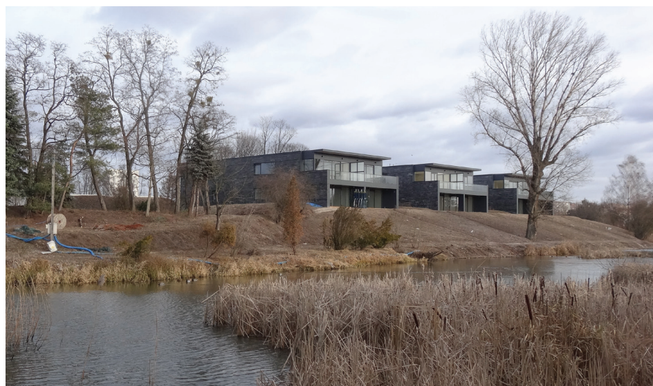
Fig. 7. Fort Cze (Piłsudski) in Warsaw. View of the fort buildings

– zdecydowanie najmniej odpowiednia dla tych obiektów. Realizacja ma polegać na maksymalnym upraszczaniu lub wręcz usuwaniu form ziemnych, a na „uwolnionych” w ten sposób terenach wznoszeniu budynków mieszkalnych. Na razie są to głównie projekty, lecz co będzie później? Częściową odpowiedź znajduje się w najaktualniejszej, bardzo kontrowersyjnej adaptacji fortu do funkcji apartamentowej, w Fortcie Cze (Piłsudskiego) Twierdzy Warszawa 6 . Przy czysto „kreatywnym” podejściu architektów na „artystycznie” odtworzonych wałach – w miejscu niedużych ziemnych poprzecznic 7 – zlokalizowano (i rozpoczęto realizację!) masywne bryły zabudowy mieszkaniowej. Według autorów projektu jest to „nawiązanie do form historycznych” – co świadczy o znacznym niezrozumieniu funkcjonowania fortyfikacji i dostosowywania do nich odpowiednich form przestrzennych. Jest to raczej architektura „pretekstu”, a nie „kontekstu” historycznego. Z konserwatorskiego punktu widzenia zdecydowanie bardziej poprawne byłoby poszukanie możliwości wprowadzenia kubatur w przestrzenie historycznych narysów i profili wałów, a nie jedynie odwołanie się do ich kształtów – z kilkukrotnym przeskalowaniem brył (il. 5–7).