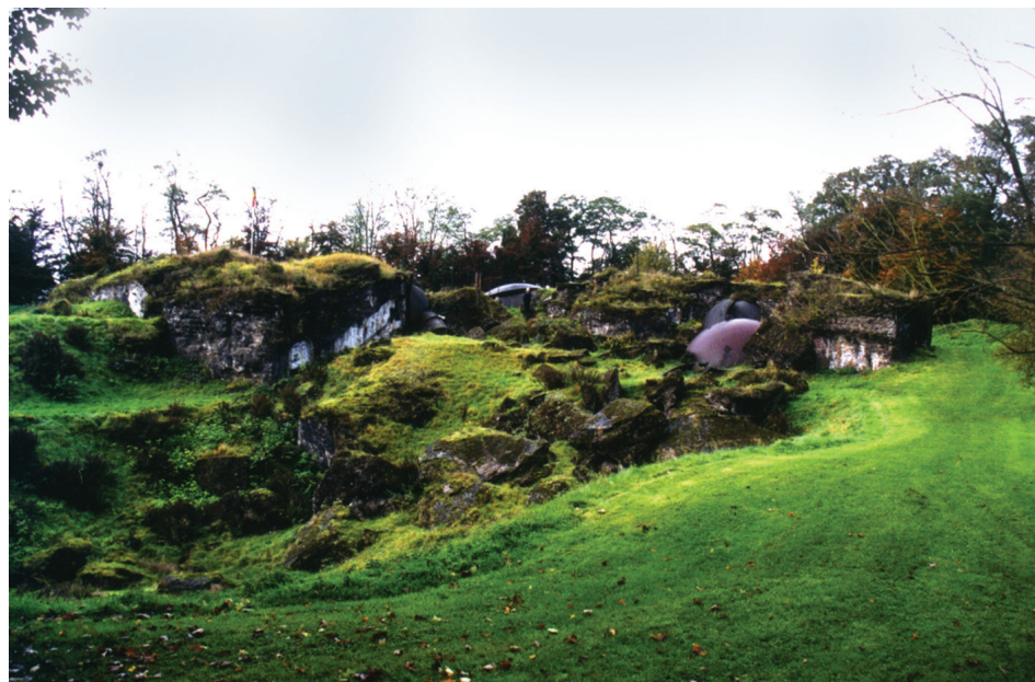
Il. 3. Fort Loncin w Liège – trwała ruina, miejsce pamięci