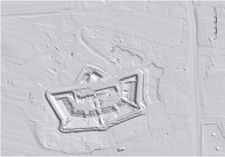
Il. 2. Fort IV Chrzanów w Warszawie, widok z góry – formy fortu czytelne, zdjęcie w technologii LiDAR