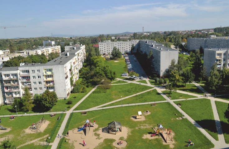
Il. 1. Zielona przestrzeń biegnąca przez osiedle Barwinek / Green area of the Barwinek housing estate

rowanych terenów zielonych, które przy odpowiednim podejściu mogłyby stać się elementem wyróżniającym je spośród współczesnych zespołów.