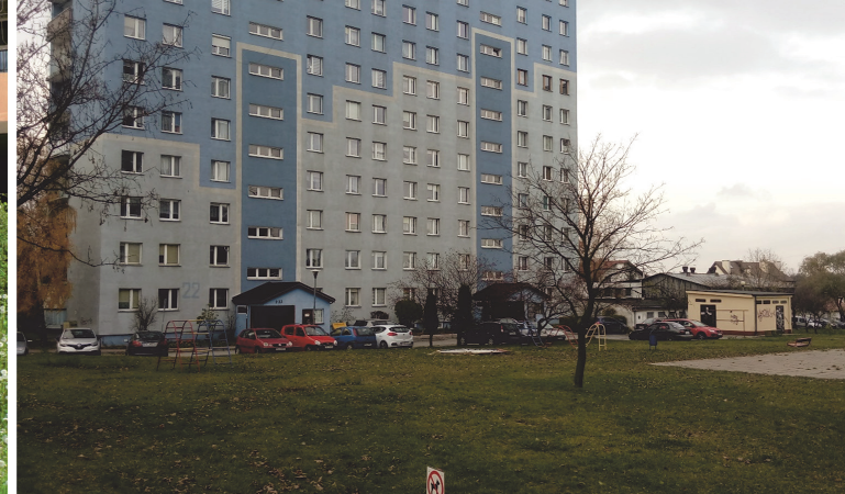
Il. 4. Parkingi w sąsiedztwie placów zabaw. Osiedle Barwinek / Parking lots adjacent to playgrounds. Barwinek housing estate.

Zauważalnym jest zjawisko parkowania pojazdów we wnętrzach między budynkami, na osiedlowych sieciach ulicznych, jak i w przestrzeniach zielonych. Zjawisko to jest powodem dyskomfortu, powoduje hałas, zanieczyszczenie powietrza i stanowi niebezpieczeństwo w przestrzeniach, które powinny służyć rekreacji, np. przy placach zabaw. (il. 4) Źle rozwiązana infrastruktura komunikacyjna znacząco wpływa na jakość codziennego życia mieszkańców, obniża walory użytkowe osiedla i stanowi zagrożenie.