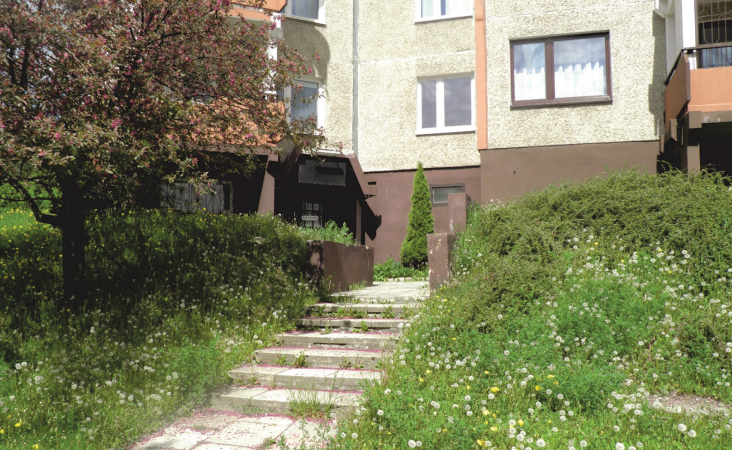
Il. 3. Schody terenowe. Osiedle Pod Dalnią / Terrain stairs. Pod Dalnia housing estate