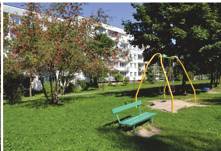
Il. 8. Plac zabaw. Osiedle Barwinek (fot. autorka) / Playground. Barwinek housing estate. (photo by the author)

nych zespołów, w których w szczególności brakuje szkół i przedszkoli.