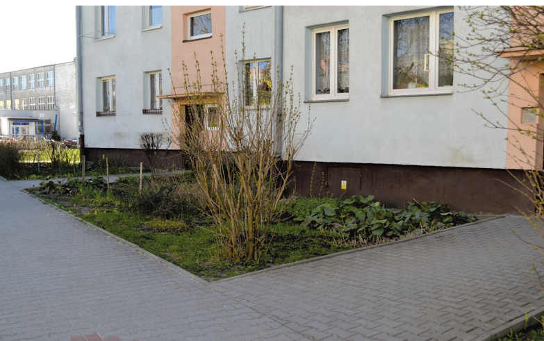
Il. 7. Ogródki przydomowe. Osiedle Bocianek / Home gardens. Bocianek housing estate.