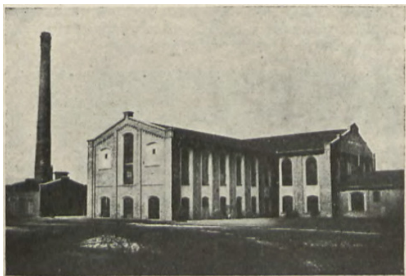
Fot. 2. Żychlin, główny budynek fabryki

Jak widać zakres produkcji był obszerny i obejmował: silniki prądu stałego, silniki trakcyjne, silniki prądu zmiennego dużej mocy, generatory do elektrowni i transformatory WN. Produkty odpowiadały na zapotrzebowanie ówczesnego przemysłu, energetyki i elektryfikacji transportu w Polsce.