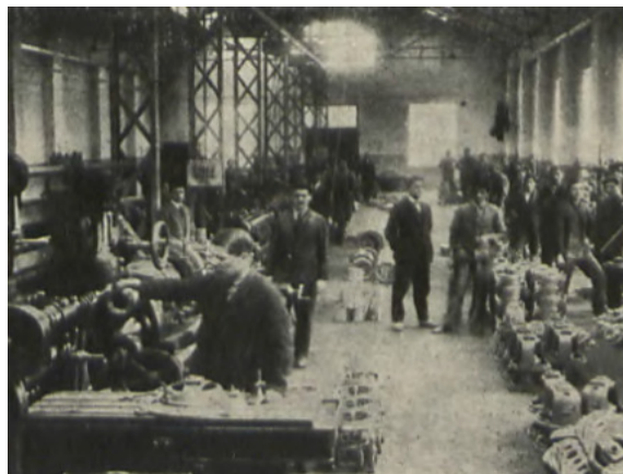
Fot. 5. Cieszyn fragment wnętrza fabryki