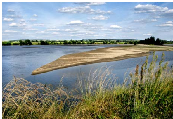
Photo 1. Natural values listed by the respondents as first ones among non-material values are visible almost all along the Vistula.