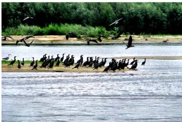
Fot. 1. Wartości przyrodnicze wymieniane przez badanych studentów na 1 miejscu wśród wartości niematerialnych widoczne są na niemal każdym odcinku biegu Wisły.

Photo 1. Natural values listed by the respondents as first ones among non-material values are visible almost all along the Vistula.