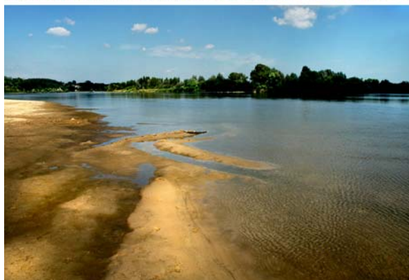
Fot. 2. Wartości estetyczne i krajobrazowe rzeki, często pomijane w edukacji geograficznej, były dostrzeżone przez respondentów na 3 miejscu w rankingu wartości niematerialnych (fot. J. Angiel).

Photo 2. Aesthetic and scenic values of the river, which are often passed over in geographical education, were listed by the respondents on the third place among non-material values (photo by J. Angiel).