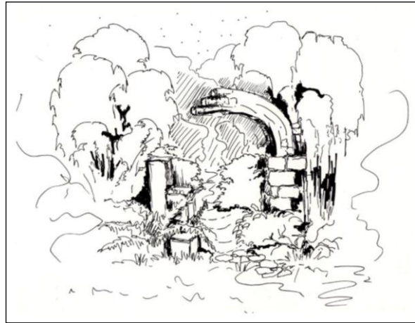
Fig. 2. The sketches are an examples presenting the phenomenon of penetration across the setting, mixing and passing away. Composing in space elements should copy existing forms (a) and use their existence (b), founding future reference to nature (c) The sketches showing formation the space and were executed during investigations in the contemporary XVIII century English landscape gardens.

Ryc. 2. Szkice ilustrujące przykładowo zjawisko przenikania poprzez wtapienie, mieszanie i przemijanie. Komponowanie elementów w przestrzeni powinno naśladować istniejące formy (a) wykorzystywać ich istnienie (b), zakładając przyszłe odniesienie do natury (c). Szkice ilustrujące kształtowanie przestrzeni przenikania wykonane podczas badań w istniejących, założonych w XVIII w. ogrodach angielskich).