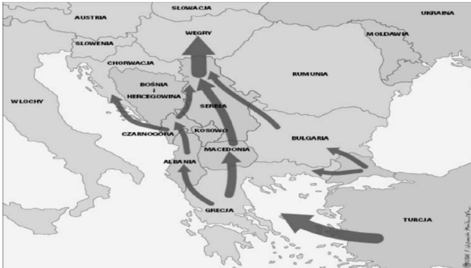
Rys. 3. Główne szlaki nielegalnej migracji w Europie południowo-wschodniej