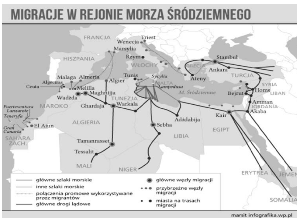
Rys. 1. Migracje w rejonie Morza Śródziemnego

Kraje Unii Europejskiej stoją w obliczu napływu imigrantów określanego jako najostrzejszy kryzys migracyjny od czasu drugiej wojny światowej. Problem staje się coraz większym wyzwaniem dla niemal wszystkich państw kontynentu. Zamykane są kolejne granice, co przekłada się na tworzenie nowych tras dla osób uciekających przed wojną oraz szukających lepszych warunków do życia. Szlaki uchodźców z Syrii, Afganistanu i Erytrei prowadzą przez Morze Śródziemne do Włoch i Grecji, a także drogą lądową przez Turcję oraz Bałkany Zachodnie. Ich trasy często zmieniają się i przybierają inne kierunki (rys. 1 i 2).