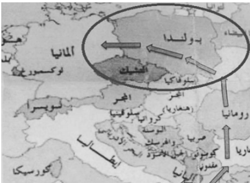
Rys. 2. Potencjalny nowy szlak imigracyjny

Coraz częściej, w opiniach analityków i mediów, pojawia się nowy szlak uchodźczy przez Bułgarię, Rumunię, zachodnie tereny Ukrainy oraz południową Polskę.